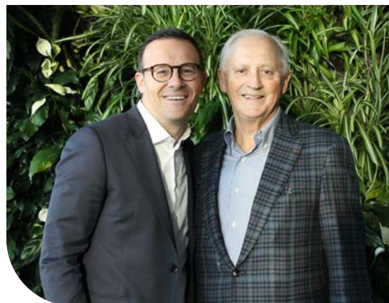
Monsieur Guy Cormier et monsieur Alban D'Amours lors de l'activité retrouvailles dans le cadre de la Semaine de la coopération.

Pour rejoindre la clientèle étudiante, une tournée provinciale de conférences a permis à plusieurs centaines d'étudiants collégiaux et universitaires de se familiariser avec le modèle coopératif. De plus, la diffusion de 3 webinaires et web conférences aura également permis aux personnes intéressées de se familiariser avec l'outil collégial Jeune COOP, de découvrir des modèles de coopératives innovants et de mieux appréhender l'avenir des médias en compagnie d'acteurs du milieu. Un cocktail retrouvailles des anciens récipiendaires de l'Ordre du Mérite coopératif et mutualiste québécois, avec la présence d'honneur de monsieur Guy Cormier, président et chef de la direction du Mouvement Desjardins, a conclu cette semaine de festivités. C'est d'ailleurs à cette occasion que le RDV 2020 coopération + mutualité a été lancé.