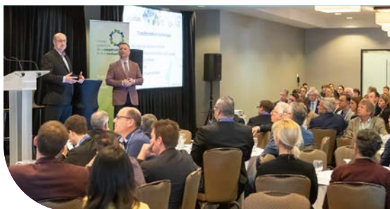
Tableau de bord du Plan stratégique des réseaux coopératifs et mutualistes 2015-2020

Ceux-ci ont notamment guidé le choix des thématiques pour l'événement RDV2020 coopération + mutualité . Cependant, en cours d'année, le conseil d'administration a mis cette question en suspens pour revisiter la mission, les besoins et les attentes des membres à l'égard du CQCM. L'objectif était de redéfinir clairement les assises qui soutiennent les réseaux dans leurs ambitions. Ce travail se poursuivra au cours de l'année 2020.