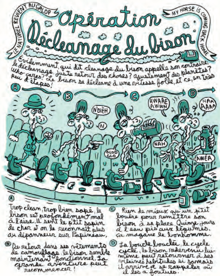
Figure 6 – Richard Suicide, Chroniques du Centre-Sud , Pow Pow, p. 64.

projet artistique du bédéiste. Raconter ce lieu, ce n'est pas seulement le décrire. C'est par le recours aux anecdotes et aux souvenirs ainsi qu'aux outils de la cartographie et du parcours que Suicide parvient à saisir l'essence de ce que fut jadis ce lieu. L'amalgame des différentes parties de la bande dessinée – celles plus ironiques et les autres plus nostalgiques – crée un album où, d'une part, on insiste sur le caractère cyclique de la vie du quartier et, d'autre part, où on fait le constat de la disparition de l'âme de Centre-Sud provoquée par son embourgeoisement.