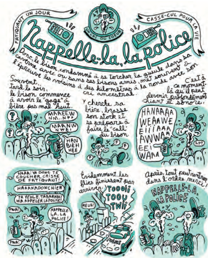
Figure 4 – Richard Suicide, Chroniques du Centre-Sud , Pow Pow, p. 54.

C'est d'ailleurs l'une des forces de la bande dessinée que d'insister sur cette langue particulière du quartier, sorte de dialecte qui fonctionne parfois aux sons. Lors de sa première rencontre avec le bison, le narrateur affirme même ceci : « Cette rencontre avait vraiment fait notre journée, comme si on venait de communiquer avec un extra-terrestre à l'aide d'un code universel hyper sophistiqué 51 ! » Centre-Sud est ainsi dépeint comme un quartier où l'on a son propre langage et où l'on communique avec son propre code.