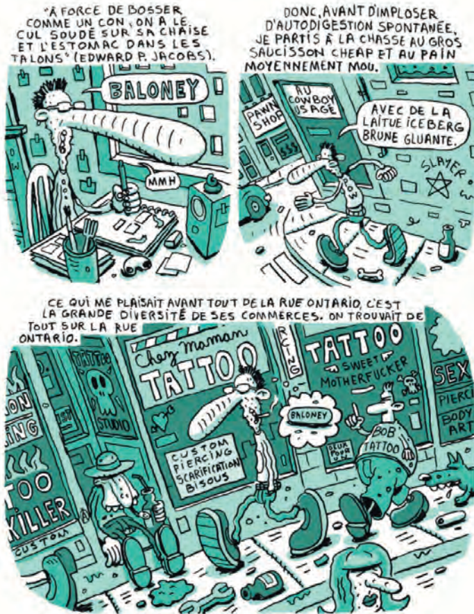
Figure 1 – Richard Suicide, Chroniques du Centre-Sud , Pow Pow, p. 39.

Le quartier Centre-Sud est également le sujet de l'une des histoires de My Life as a Foot , intitulée « South-Center Chronicle », épisode que l'on peut considérer comme annonciateur de l'œuvre de 2014. En plus de ce titre qu'ils partagent, le segment de My Life as a Foot et Chroniques du Centre-Sud entretiennent de nombreuses similarités. Tous deux mettent en scène des personnages qui vivent en marge de la