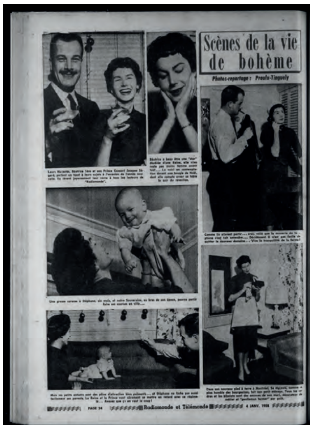
Figure 3 – Proulx-Tinguely, « Scènes de la vie de bohème », Radiomonde et Télémonde , 4 janvier 1958, p. 24.

et exercent une pression malsaine sur les mères, à qui le périodique envoie le message qu'elles peuvent très bien tout avoir – une carrière stimulante, un partenaire aimant, des enfants bien élevés – sans devoir faire appel à du soutien extérieur.