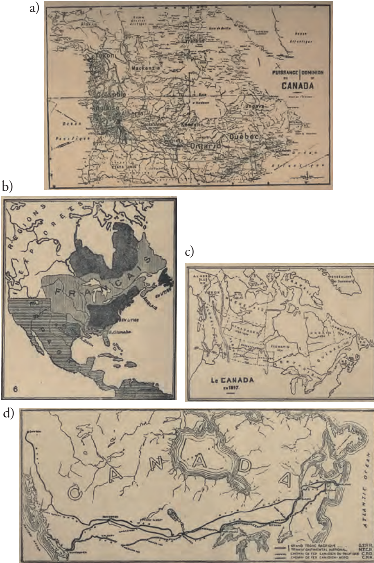
Figure 2 – a) Le cadre physique canadien; b) L'Amérique du Nord et les puissances coloniales c) La Confédération canadienne; et d) Les trois chemins de fer transcanadiens. Cartes tirées de la seconde édition de Terres et peuples du Canada , 1913, p. 21, 40, 62 et 72.