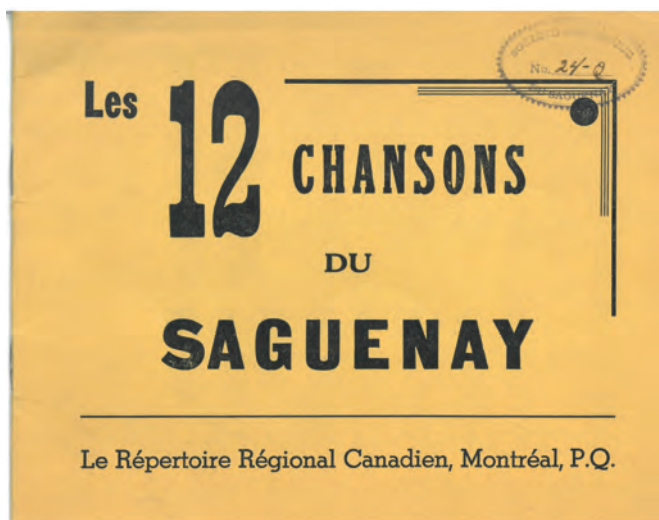
Figure 2 – Page couverture du cahier Les 12 chansons du Saguenay , 1939.

1938 34 . Il n'est pas compositeur toutefois, et les chansons nouvelles du recueil s'entonnent sur des airs connus, comme celui d' Auprès de ma blonde . Si la plupart laisseront peu de traces, il en est une qui sera chantée jusqu'au XXI e siècle, l' Hymne au Saguenay .