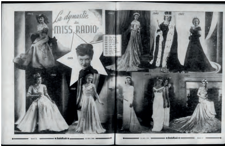
Figure 2 – « La dynastie des Miss Radio », Radiomonde , 11 décembre 1948, p. 12-13.