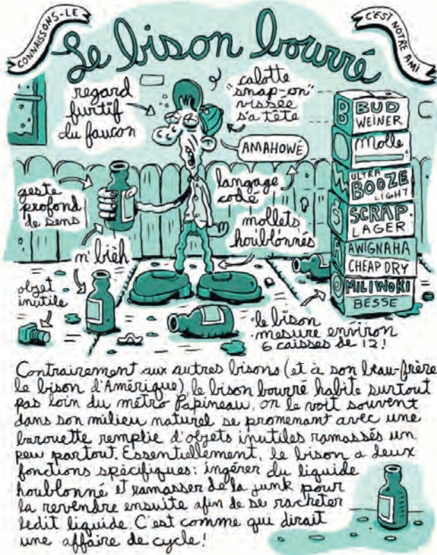
Figure 3 – Richard Suicide, Chroniques du Centre-Sud , Pow Pow, p. 27.

En fait, c'est toute la vie du bison qui est cyclique : ses soirées se déroulent toujours selon le même rituel et se terminent inévitablement par une intervention policière, comme on peut l'observer dans l'épisode intitulé « Nappelle-la, la police » (figure 4).