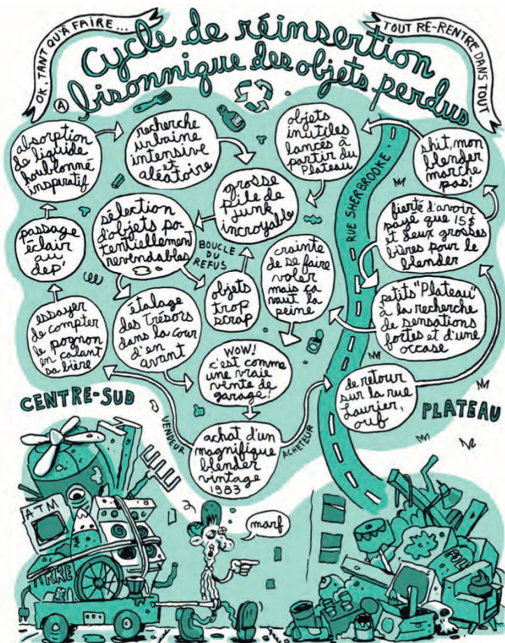
Figure 5 – Richard Suicide, Chroniques du Centre-Sud , Pow Pow, p. 30.