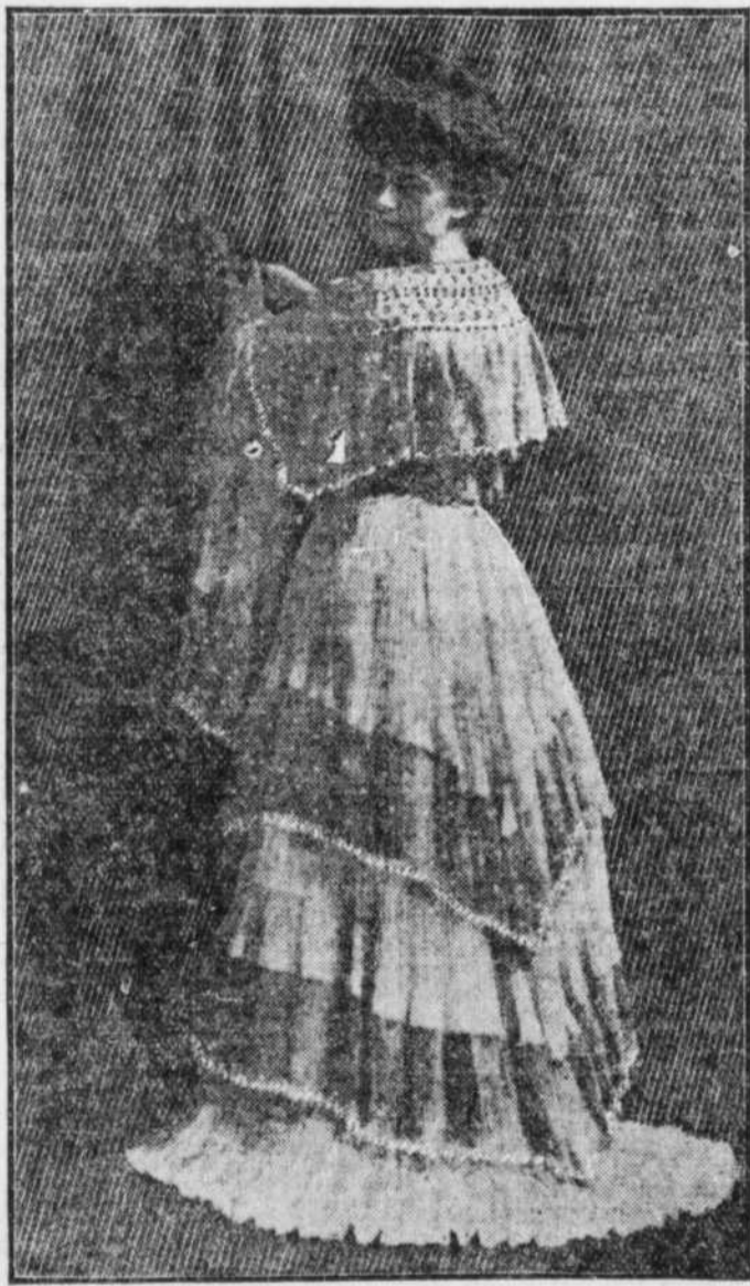
Tollett: d'intérieur très élégante en mousseline bleu pâle plissée, garnie de dentelle. Le col est formé de rubans brodés et d'entre-deux de dentelle.