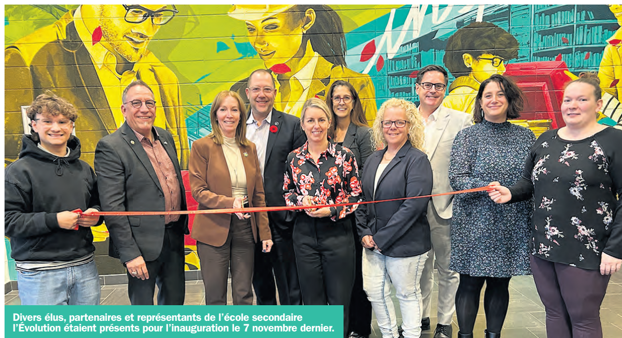
Divers élus, partenaires et représentants de l'école secondaire l'Évolution étaient présents pour l'inauguration le 7 novembre dernier.

Le Centre de services scolaire des Samares a procédé à l'inauguration de la nouvelle école secondaire l'Évolution à Saint-Lin-Laurentides, le vendredi 7 novembre.