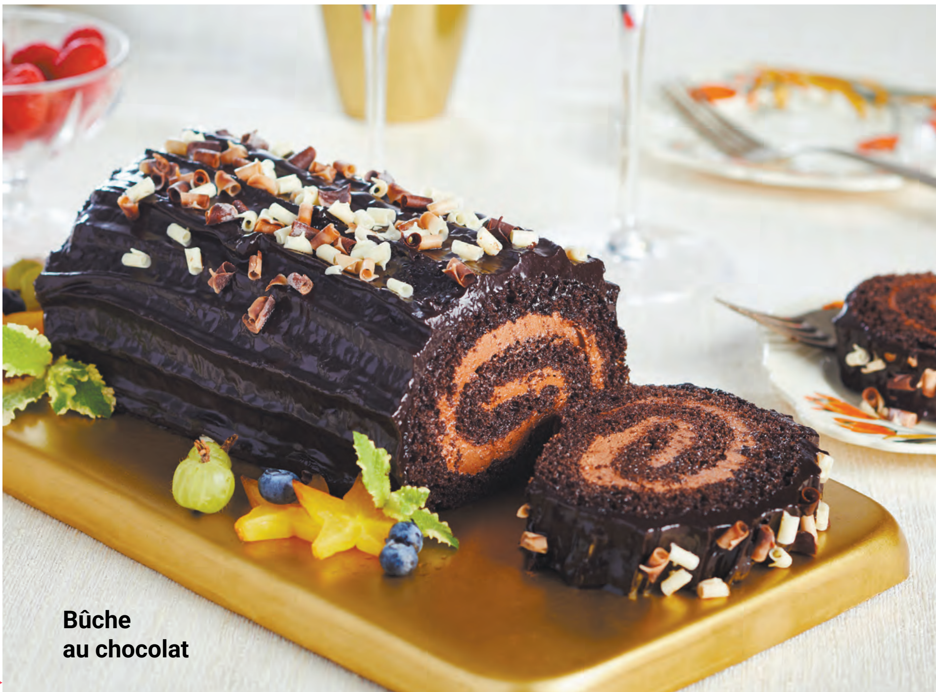
Bûche au chocolat