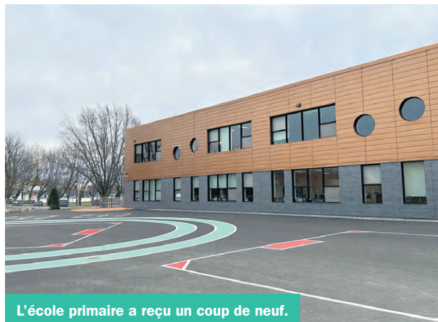
L'école primaire a reçu un coup de neuf.

Le vendredi 7 novembre, le Centre de services scolaire des Samares inaugurerait l'agrandissement de l'école primaire Notre-Dame à Saint-Roch-de-l'Achigan.