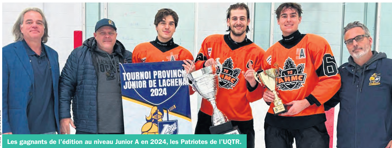
Les gagnants de l'édition au niveau Junior A en 2024, les Patriotes de l'UQTR.