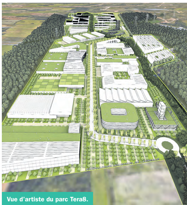
Vue d'artiste du parc Tera8.