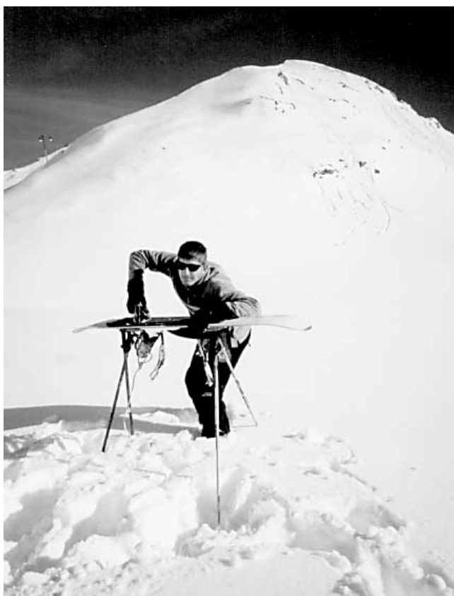
Séance de repassage extrême.

Le repassage extrême consiste à amener un fer à repasser et (si possible) une planche dans un endroit éloigné et, comme de raison, à y repasser des vêtements. Il a été inventé en 1997 par un Anglais qui a décidé de combiner son activité préférée (l'escalade) à sa plus détestée (le repassage). Il est aujourd'hui pratiqué par plus de 200 fous furieux aux quatre coins du monde.