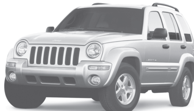
JEEP LIBERTY 2003

SEULEMENT CHEZ VOTRE CONCESSIONNAIRE CHRYSLER • JEEP MD • DODGE