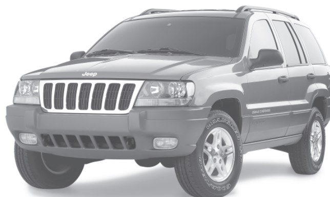
JEEP GRAND CHEROKEE 2003