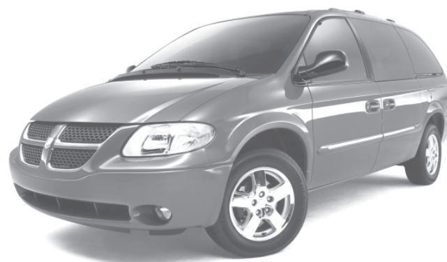
DODGE GRAND CARAVAN 2003