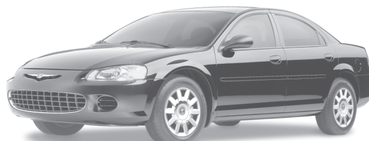
CHRYSLER SEBRING 2003