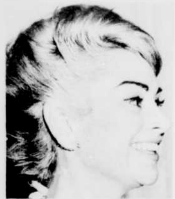
Martine Carol, à «Mythes et monstres sacrés», samedi à 1 h. 30.