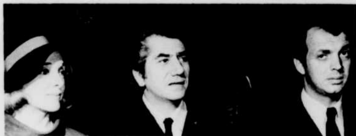
Micheline Presle, Daniel Gélin et Jean Becker viennent tourner à Montréal deux épisodes des «Saintes Chéries».