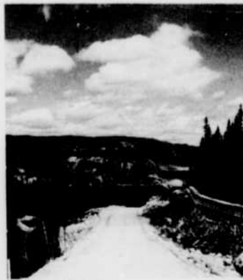
La région du Saguenay