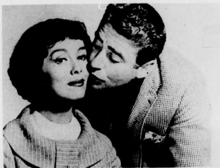
Peter Lawford et Phyllis Kirk, MONSIEUR ET MADAME DÉTECTIVES, prennent quelques minutes de détente avant d'enquêter sur «L'Etoile de Mato Grosso», épisode qui sera à l'affiche dimanche à 4 h. 30.