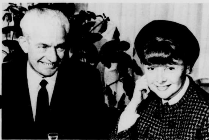
Odette Joyeux et son mari Philippe Agostini, en visite à Montréal.

Arrivés très discrètement à Montréal, presque sans s'être fait annoncer, Odette Joyeux et son mari Philippe Agostini sont descendus d'avion un jour que le thermomètre descendait également... sous zéro.