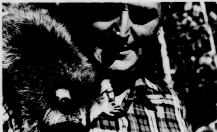
L'ami Harvey racontera la vie nocturne des animaux à LA VIE QUI BAT, mardi à 5 h. 30.