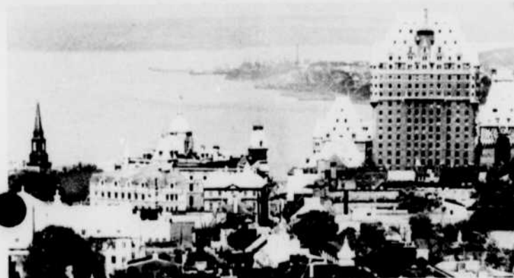
Vue de la ville de Québec