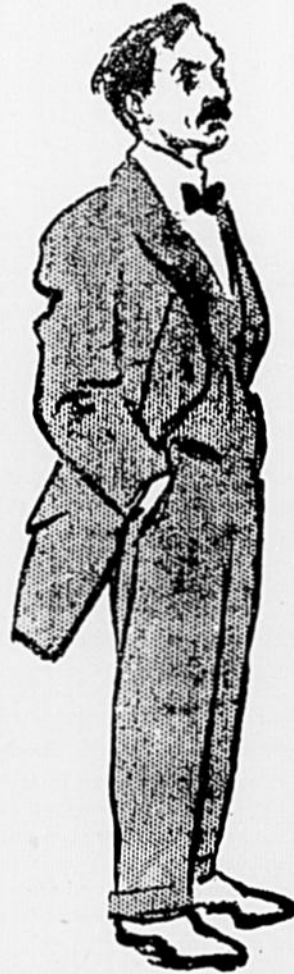
Le barbier de la ruelle Latham.

Mtre Darveau qui était perspicace en même temps qu'intelligent, n'avait pas tardé à deviner que la politique lui offrait de brillantes perspectives et il avait aussitôt sacrifié ses attaches libérales pour donner son al-