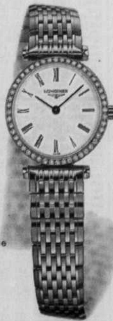
La Grande Classique de Longines