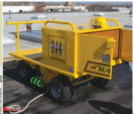
1.2c) Ancre pontuel temporaire, amovible et à corps mort