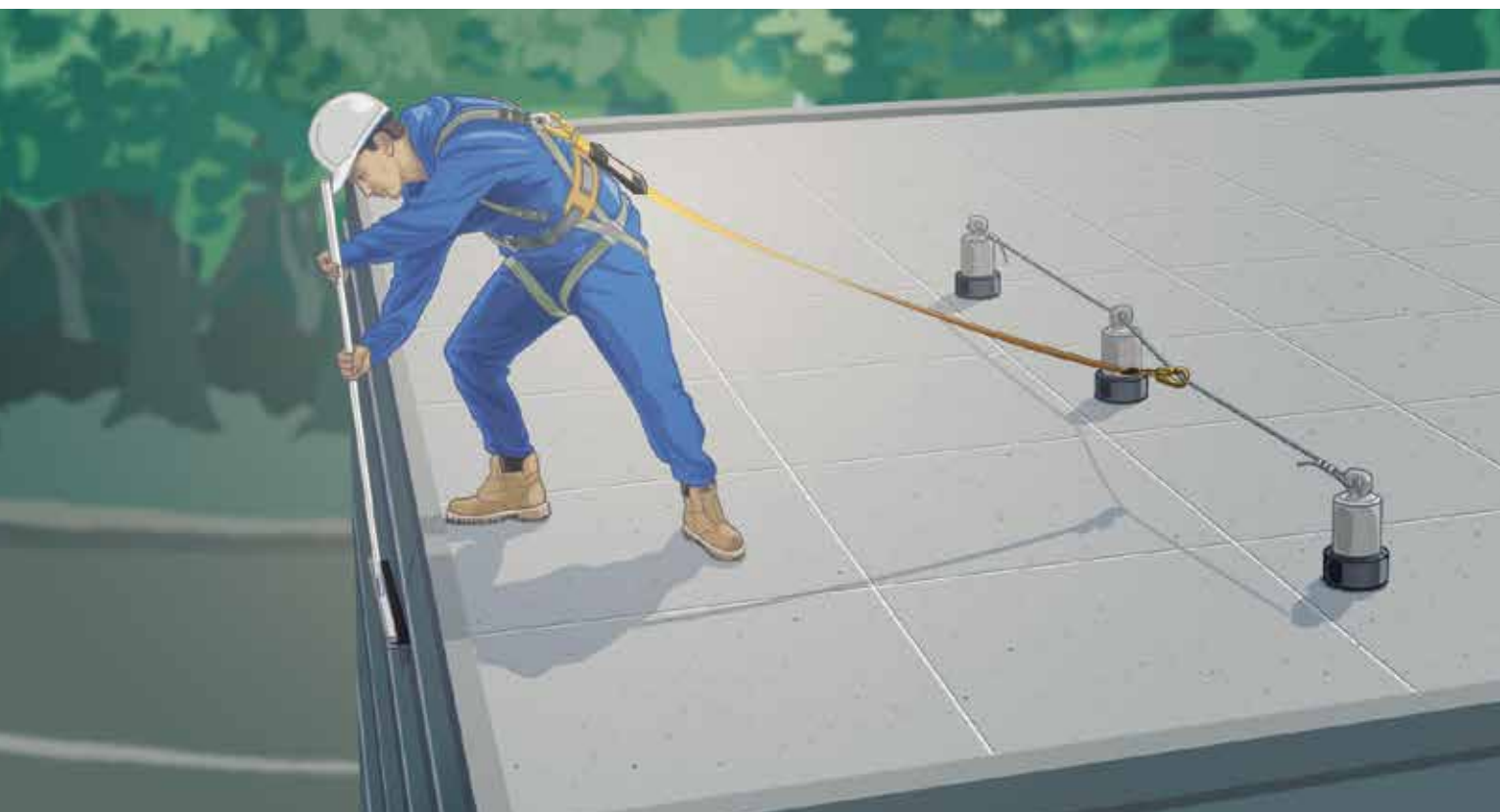
Illustration : Steve Bergeron

Parmi ces systemes, on distingue principalement les systemes d'ancrage continus flexibles (corde d'assurance horizontale) et les rigides (rails en acier).