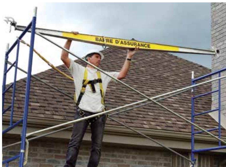
3.1) Ancre continu rigide et permanent