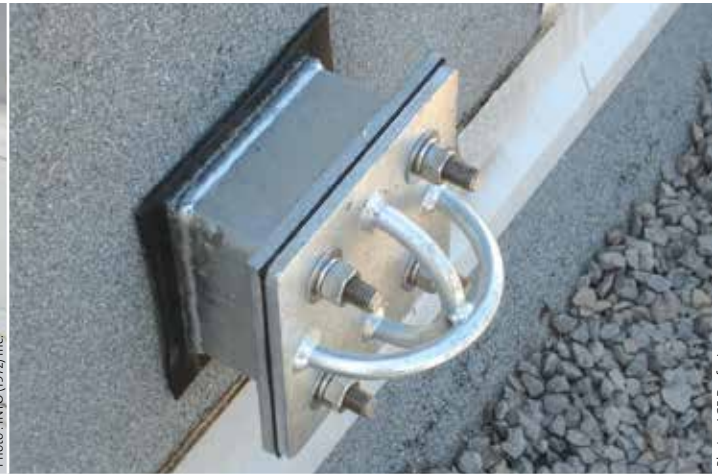
1.1) Ancre pontuel permanent