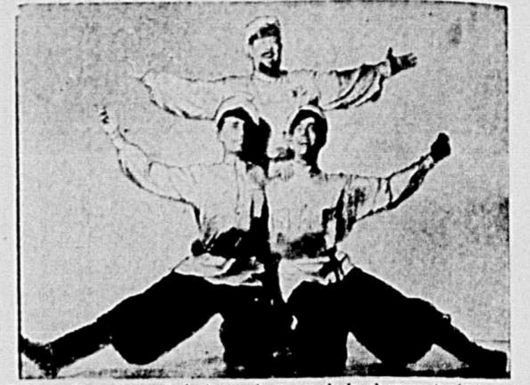
Trois ambassadeurs de la bonne humeur, de la chanson typiquement russe et des danses endiablées du Caucase. Ils seront au St-Denis les jeudi et vendredi, 25 et 26 janvier avec le choeur russe des Cosaques du Don du général Platoff, qui a obtenu un véritable triomphe l'an dernier, au St-Denis.