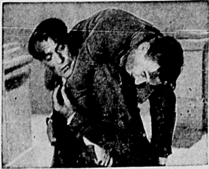
Une scène de "CASANOVA BROWN", mettant en vedette Gary Cooper, au Palace.