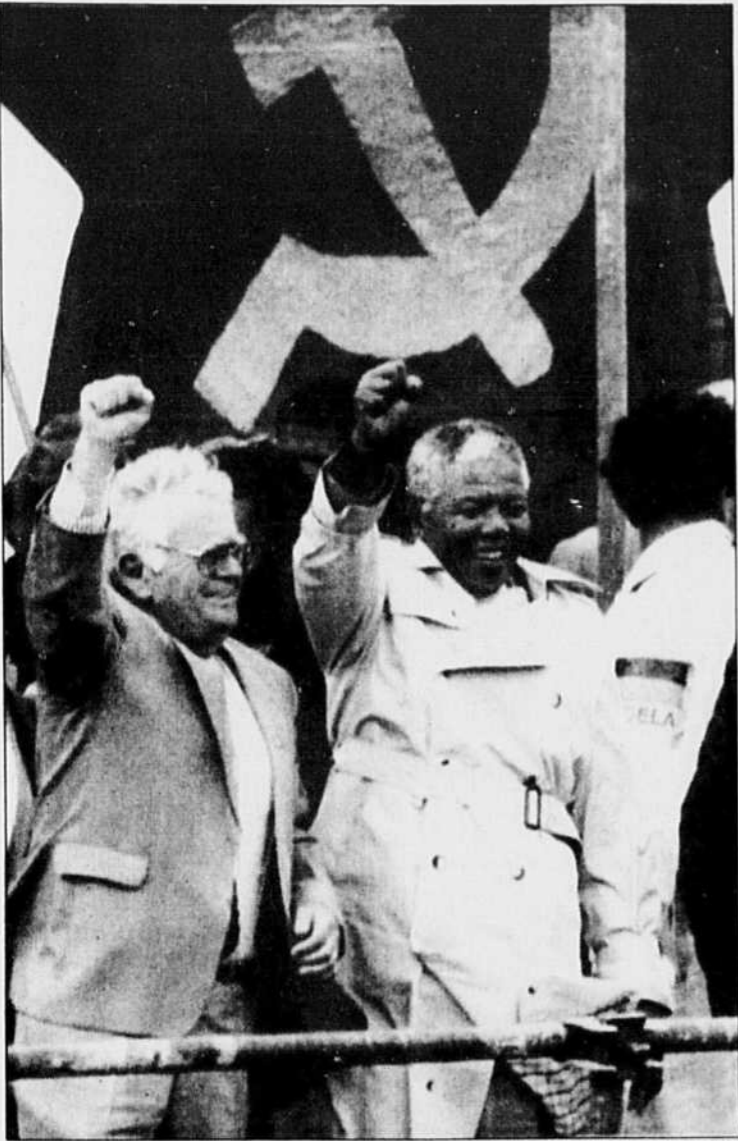
Joe Slovo et Nelson Mandela, hier, à Mitchell's Plain.

Quelque 380 000 soldats de l'Armée rouge sont stationnés actuellement en RDA. Le maréchal Iazov, recevant M. Eppelmann, lui a réitéré l'inquiétude soviétique face au « danger pour l'équilibre des forces en Europe que représenterait l'appartenance d'une Allemagne réunifiée à l'OTAN », selon l'agence TASS. « Cela pourrait déstabiliser les relations internationales », a-t-il ajouté.