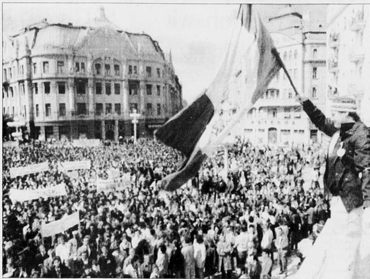
Plus de 40 000 Roumains ont manifesté hier à Timisoara contre le régime Iliescu.

Le Vietnam doit à présent résoudre ses problèmes diplomatiques, s'il veut sortir des ornières économiques dans lesquelles il est enlisé. Pour instaurer une coopération avec des partenaires économiques efficaces, il doit à tout prix trouver une solution au problème cambodgien, condition sine qua non, pour les États-Unis comme pour la Chine, d'une normalisation de leurs relations avec Hanoï.