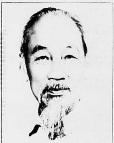
Ho Chi Minh

Le 30 avril 1975, les forces du Nord-Vietnam et du Front de Libération Nationale s'emparaient du palais présidentiel à Saigon, mettant fin à près de 30 ans de conflit armé, avec la France, puis avec les États-Unis.