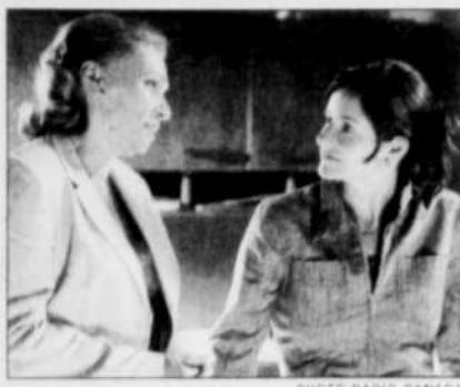
Dans « Providence » cette semaine, Edith est surprise par la décision de Marie-Eve.

FRÉDÉRIC BOUDREAU Collaboration spéciale