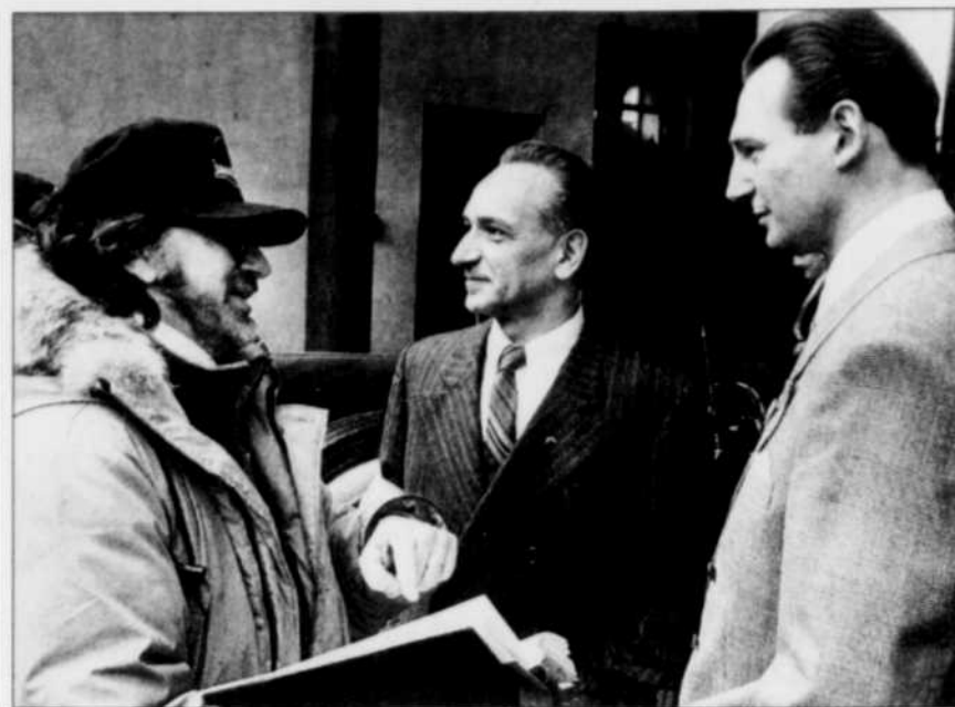
Spielberg a déjà travaillé avec Neeson dans «La Liste de Schindler»