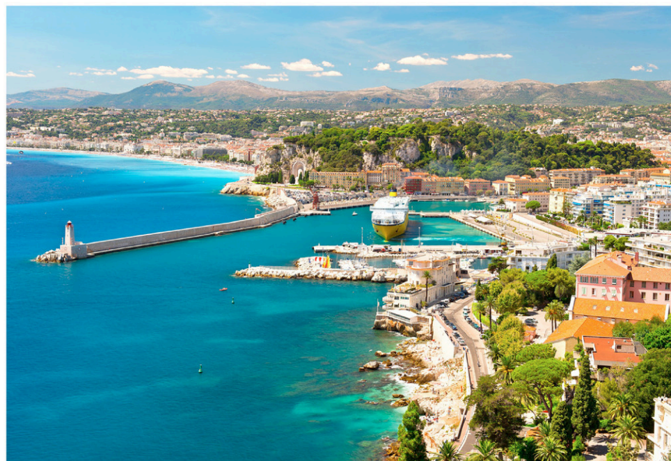
À Saguenay, seulement deux agences de voyages, dont Carpe Diem, propose le circuit Bellissima Italia de Nice à Capri. Sur la photo, une vue de Nice.

Comme ce domaine évolue sans cesse, tous les agents de Carpe Diem ont accès à des formations régulièrement. « Il faut toujours se renouveler et être à l'affût si on veut rester à jour », ajoute la passionnée agente de voyage. Évidemment, avant même de penser à faire un voyage, assurez-vous d'avoir votre passeport valide et que vos vacances soient accordées.