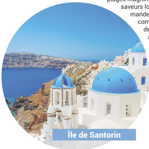
Île de Santorin

La Grèce a toujours été un terreau fertile en mythes et philosophes. Des ruines de légende parsèment ses îles idylliques, en harmonie avec les développements modernes du pays. Histoire, philosophie et art se côtoient sur des plages magnifiques et les saveurs locales ne demandent qu'à vous combler à coups de collations au feta, de produits maraîchers et de viandes assaisonnées de tzatziki.