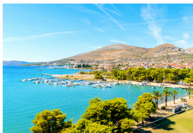
Vue sur la ville de Trogir.

La Croatie est située entre la Slovénie, la Hongrie, la Serbie et la Bosnie-Herzégovine. Elle longe la mer Adriatique sur plus d'un millier de kilomètres. Ses côtes regorgent de surprises ! On y compte des centaines de criques, de baies, de plages, de villes et de villages, tous aussi surprenants les uns que les autres. Vous pourrez profiter de votre séjour au bord de la mer pour découvrir l'une des centaines d'îles qui bordent le pays et qui offrent plus de tranquillité que les grandes villes. Vous finirez votre chemin à Dubrovnik, surnommée la perle de l'Adriatique. Ville d'art et d'histoire, son patrimoine culturel et historique vous charmera à tout coup. Cette ville est considérée par plusieurs comme l'incontournable de la Croatie.