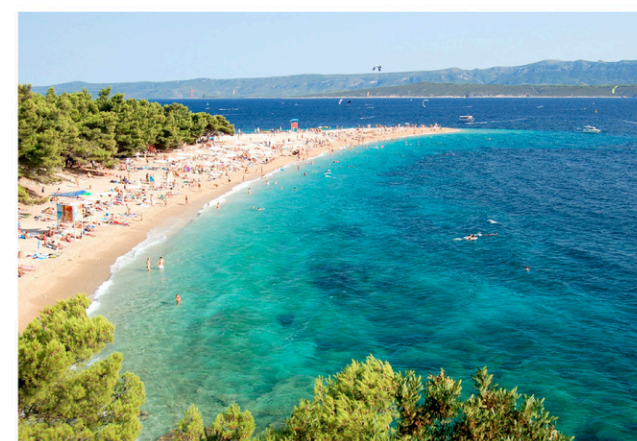
Le Golden Cap sur l'île croate de Brač.

Les températures les plus chaudes sont entre les mois de mai et septembre, moment de l'année où il y a bien sûr le plus de touristes.