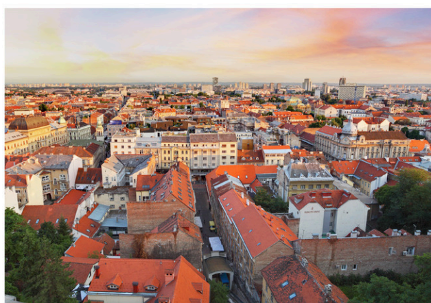
La capitale de la Croatie, Zagreb.

Influencée par ses voisins, la cuisine croate y est célébrée pour sa fraîcheur et sa diversité. Selon les régions, on peut voir dans les menus l'inspiration italienne ou hongroise dans les différents plats de pâtes et poissons servis avec des légumes et des fruits frais. Le pays est aussi connu pour ses nombreux cépages, en campagne.