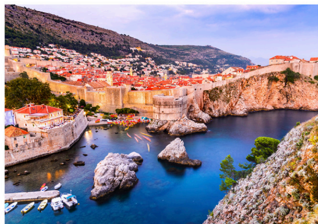
Vue de la vieille ville de Ragusa, à Dubrovnik.

Vous les avez vus tout au long de la série Le Trône de fer, les paysages de la Croatie semblent de plus en plus se démarquer auprès des voyageurs. Avec ses paysages côtiers renversants, ses villes colorées et ses températures paradisiaques en été, on comprend pourquoi de plus en plus de touristes choisissent cette destination aux limites de l'Europe Centrale et de l'Europe de l'Est.