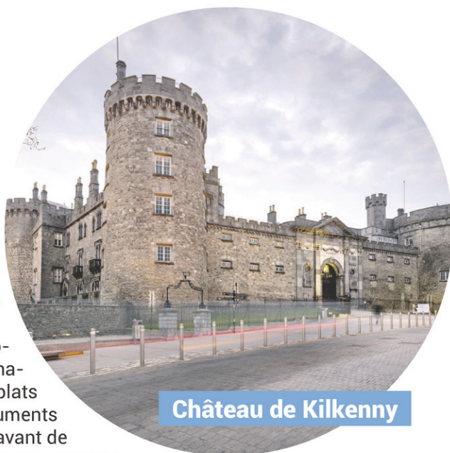
Château de Kilkenny

Pensez prendre part à un circuit multi-escales qui vous permettra de voir du pays tout en profitant de la campagne irlandaise. Visitez la mirobolante ville de Dublin, où la personnalité de l'Irlande se savoure dans les plats et les boissons. Découvrez les monuments naturels de Kilkenny et de Wicklow, avant de vous rendre à Galway, et gardez la nature sauvage de Connemara comme finale de votre visite.