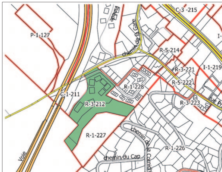
Alors que 12 zones avaient été prévues dans la version initiale du règlement, seule la zone R-3 212 demeure concernée suite aux modifications apportées le 17 octobre dernier.

À Piedmont, il est loin d'être certain que l'eau potable et la capacité d'épuration des eaux usées supporteraient l'importante augmentation de la population qu'amènerait inévitablement la densification de nombreuses zones sur le territoire. Le Journal n'a répertorié aucune étude visant à établir la capacité maximale d'accueil du territoire en fonction de la disponibilité de l'eau potable et de