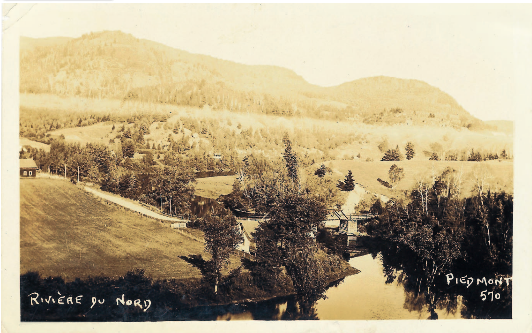
Collection privée de l'auteur