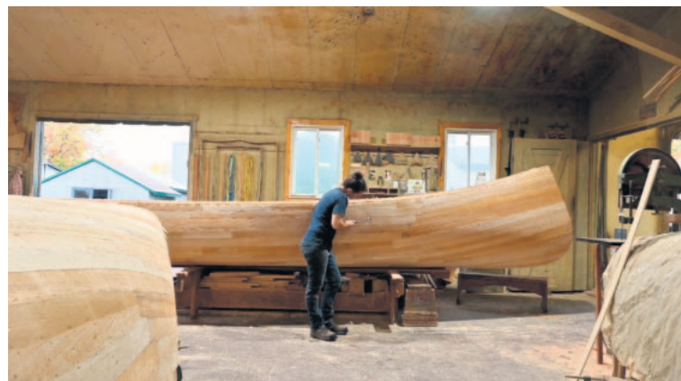
Lorraine Constantineau en plein travail chez Canots Nor-West