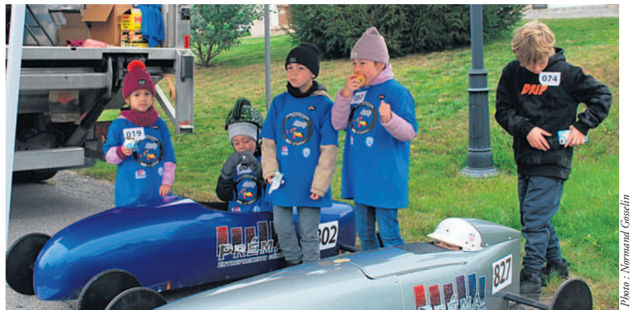
Les enfants, sa grande passion...