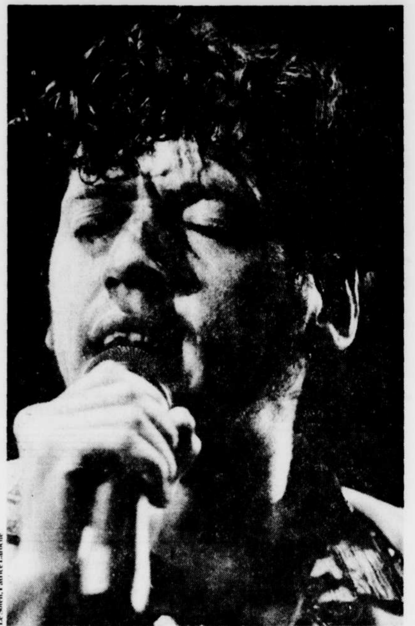
Helno le chanteur

Quant à la première partie on aurait préféré le contraire: il aurait fallu couper le micro à chaque