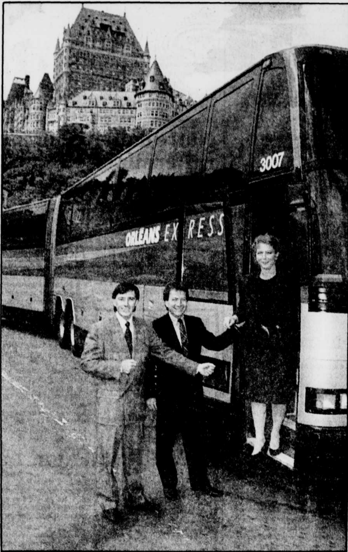
La société Autocars Orléans Express a dévoilé hier sa nouvelle identité visuelle.

Le parc d'autocars d'Orléans Express compte 84 véhicules dont 12 autobus articulés. En 1990-91, l'entreprise prévoit transporter 1,3 million de passagers. Son volume annuel de ventes devrait se situer entre 33 et 35 millions de dollars.