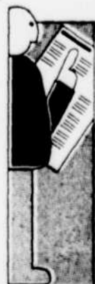
Graphique, LE SOLEIL