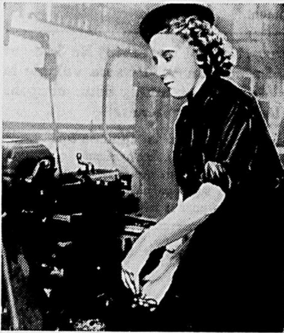
Les femmes britanniques enrôlées dans le W.R.N.S. accomplissent un excellent travail d'entretien. Elles s'avèrent d'excellents menuisiers, mécaniciens, ajusteurs, et tourneurs.