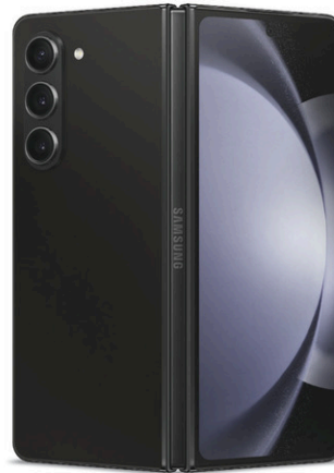
Samsung Galaxy Z Fold5

*Voir bell.ca/reseau5G pour la couverture!