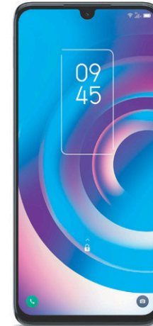
TCL 30 5G