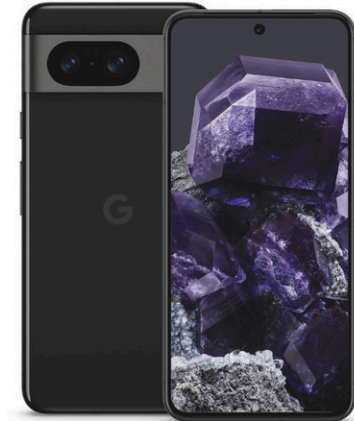
Google Pixel 8