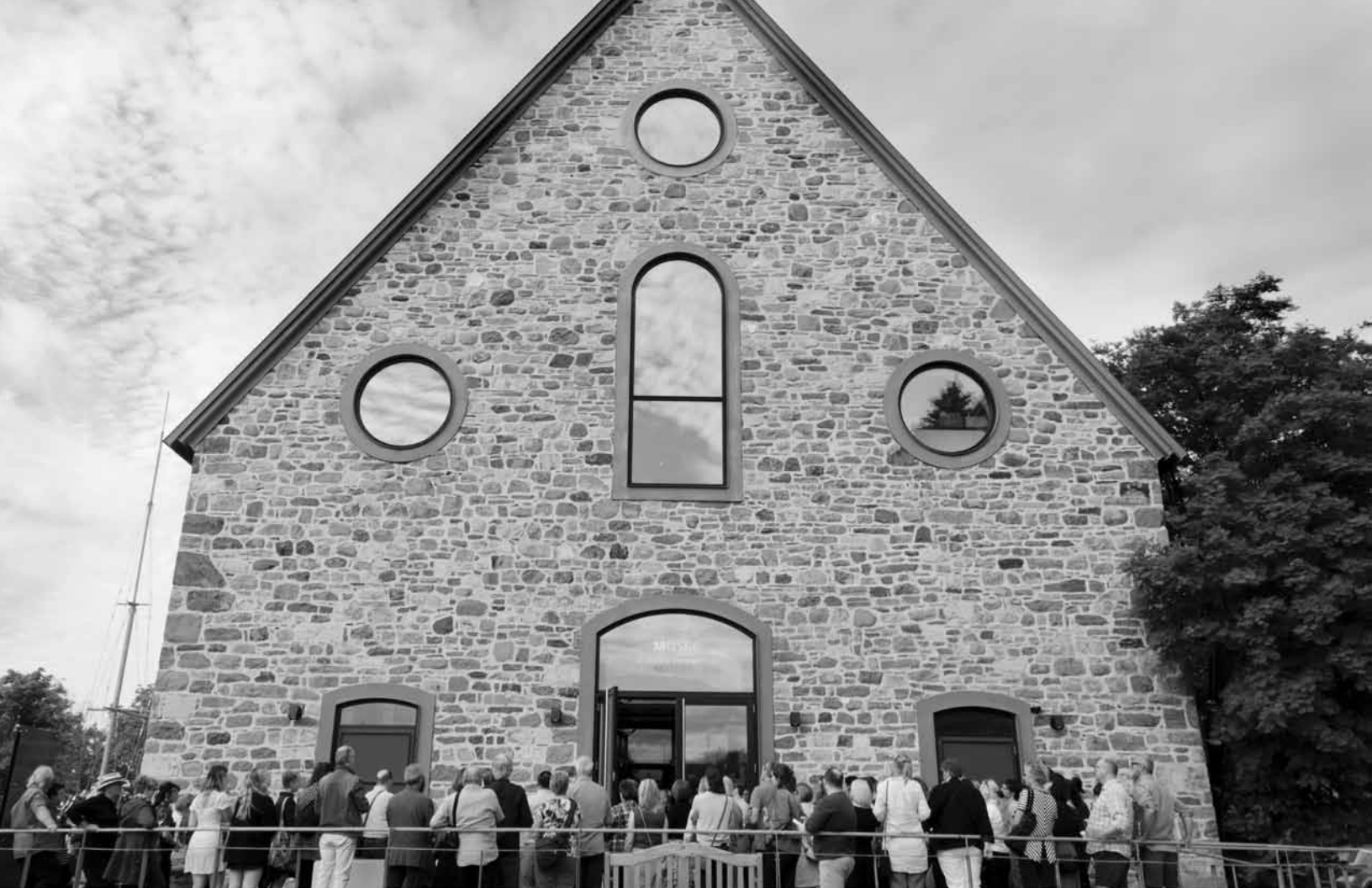
Vernissage de l'exposition Dialogues dans le temps , le Musée fête ses 50 ans!