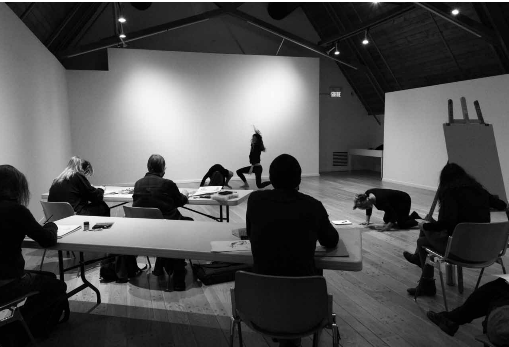
Atelier de dessin modèle vivant dans une répétition de la troupe Mars elle danse durant le mois de la danse.