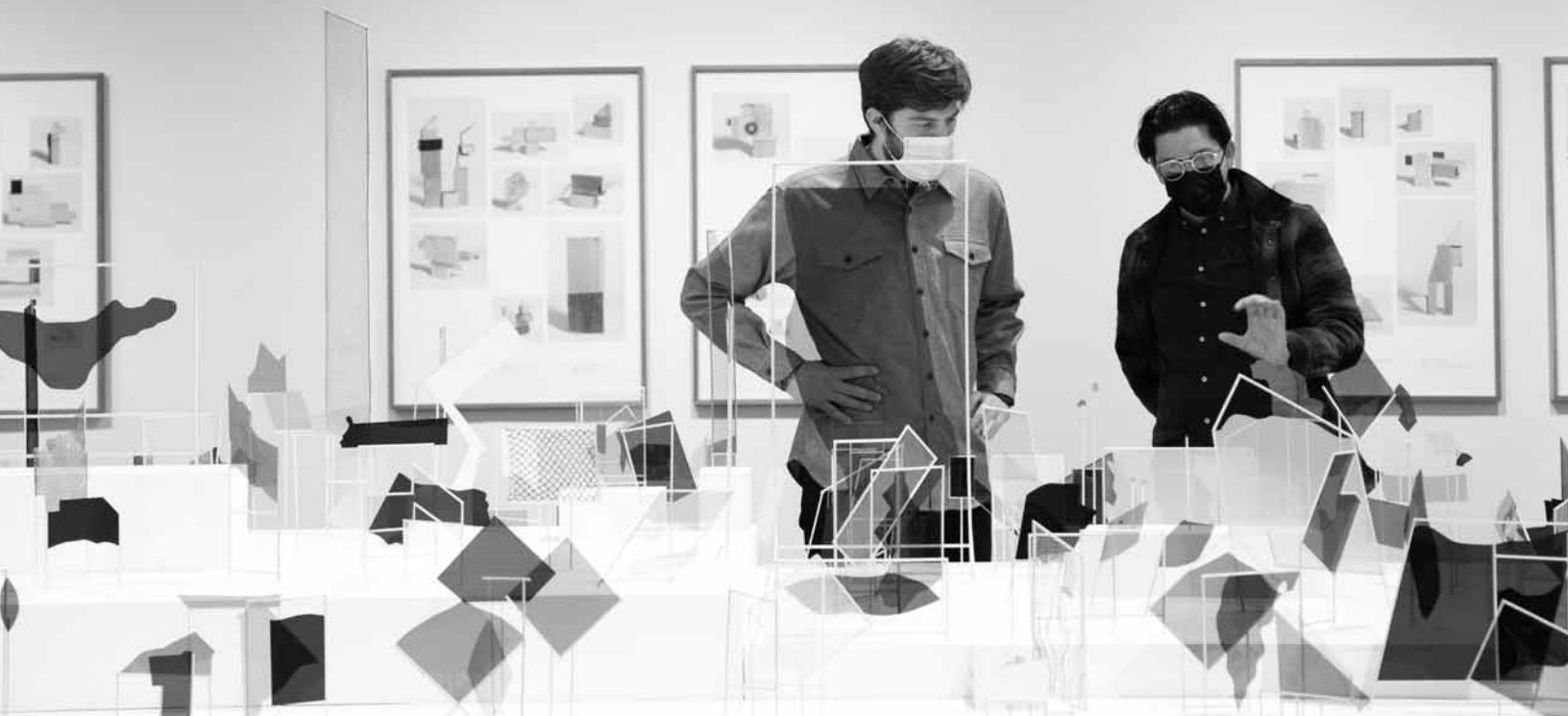
Vue de l'exposition Querelle entre deux puces à savoir à qui appartient le chien sur laquelle elles vivent de Richard Ibghy et Marilou Lemmens.