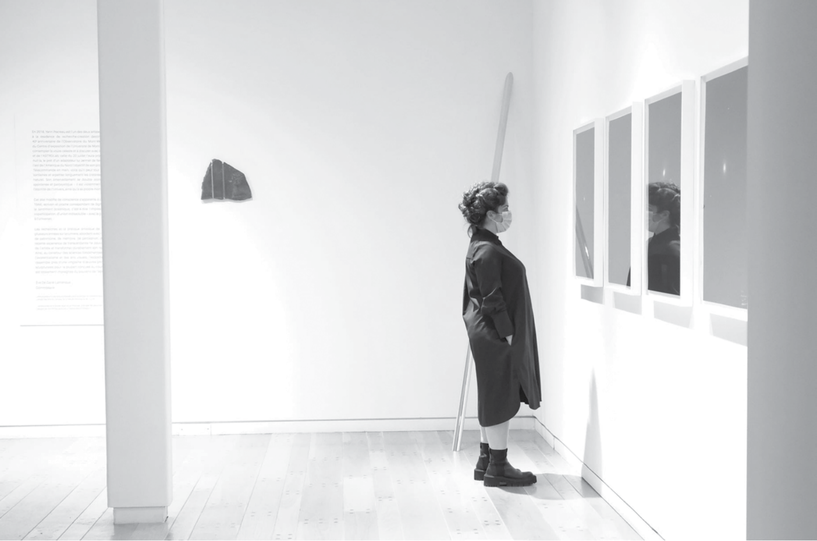
Vue partielle de l'exposition Des points mouvants de Yann Pocreau.