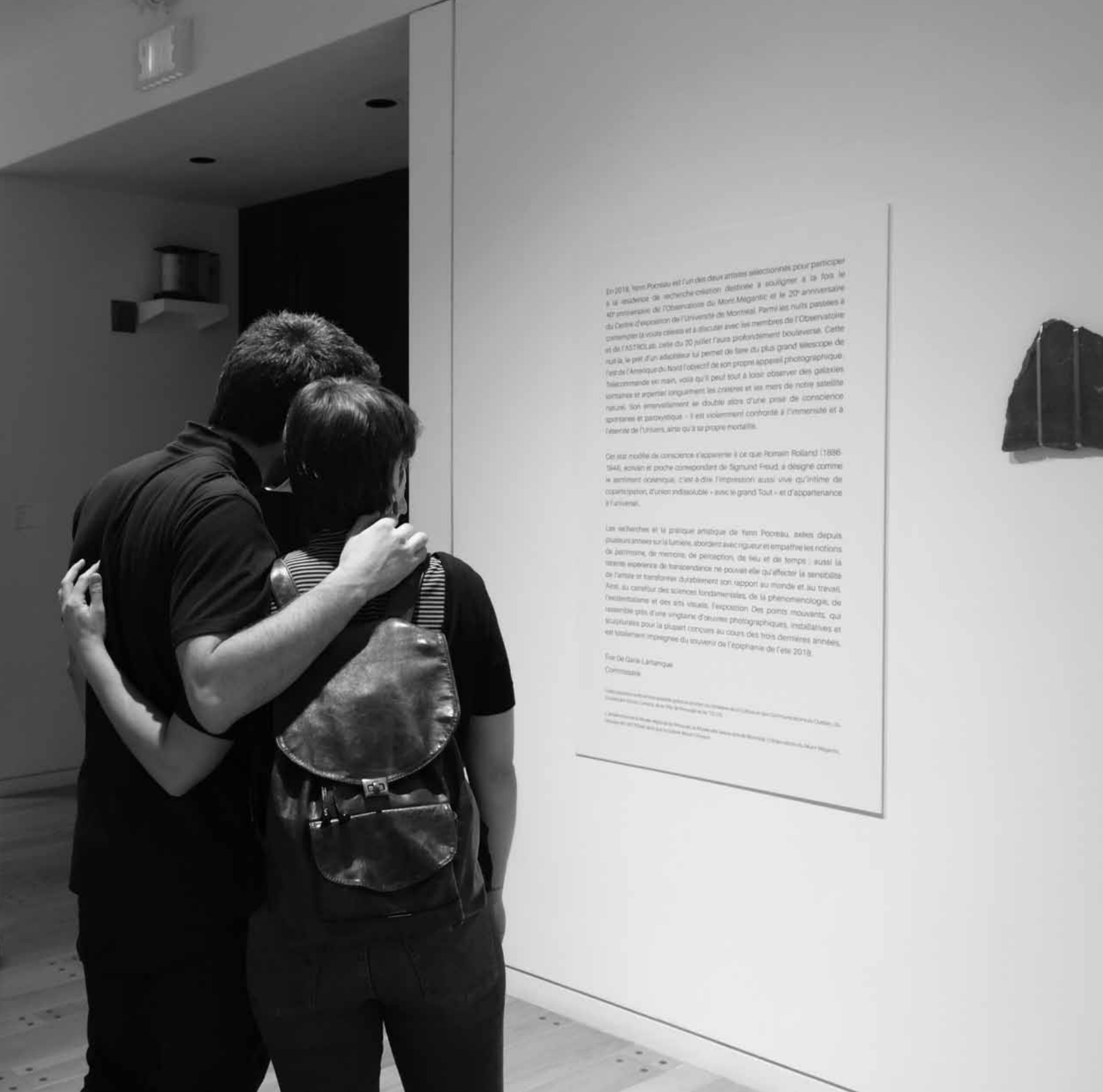
Visiteurs dans la salle Fondation Jack Herbert.