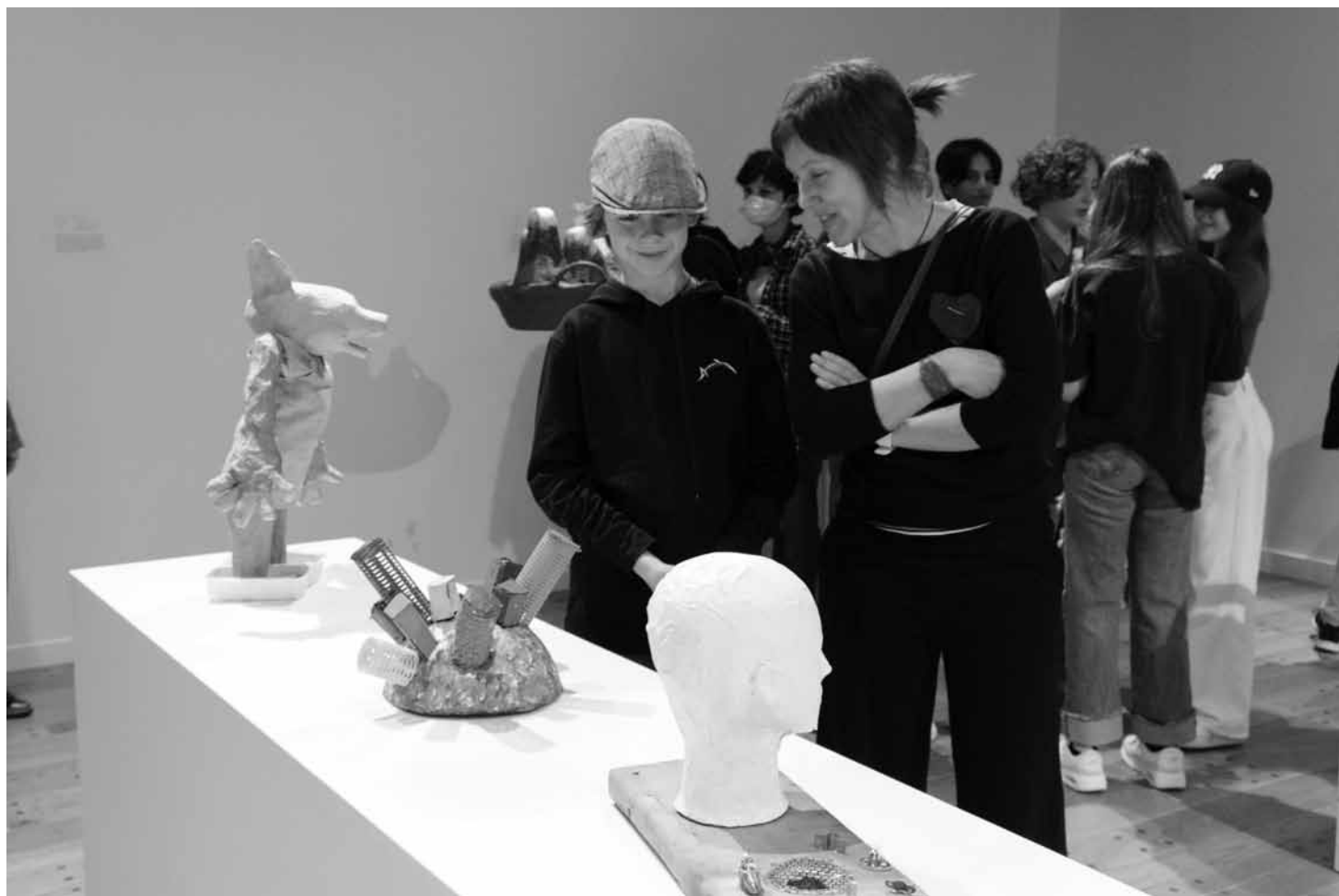
Vue partielle de l'exposition Poly-espace .

Le Musée entretient un rapport privilégié avec ses différents publics grâce à des programmes de médiation. Souvent élaborés autour de partenariats, ces programmes servent à consolider les orientations et les priorités du Musée, c'est-à-dire l'ancrage dans la communauté, la qualité et la rigueur des activités proposées et la cohérence des contenus de médiation relatifs aux expositions, en complémentarité avec lesquelles différents moyens et outils sont mis en place en fonction des publics cibles et de leurs besoins : scénarios de visites guidées adaptés, capsules vidéos, opuscules, panneaux didactiques, carnets de jeu ou petits cahiers du Musée.