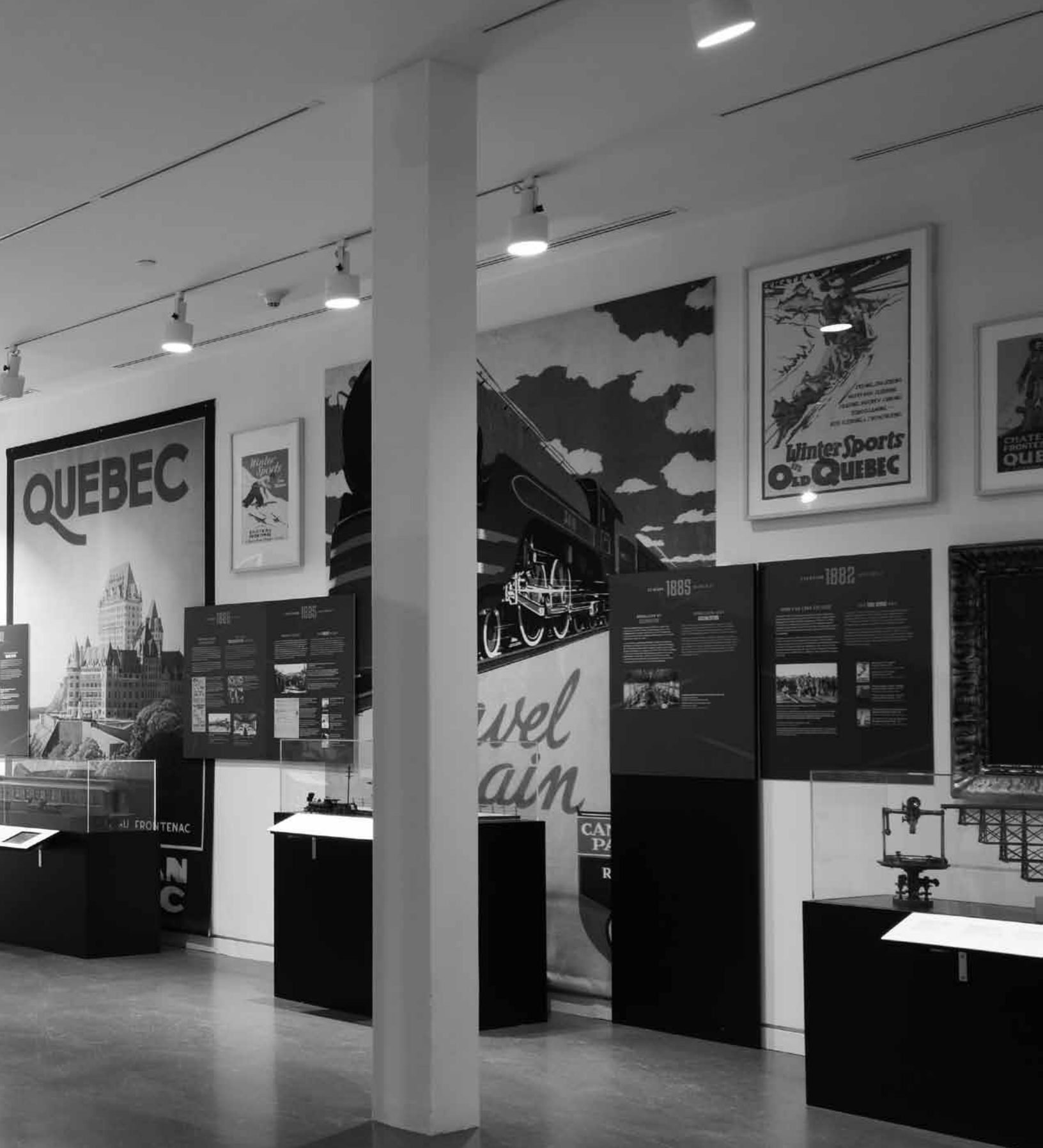
Vue de l'exposition Train transporteur de rêves , réalisée par Pointe-à-Callière, cité d'archéologie et d'histoire de Montréal avec la participation d'Exporail, adaptée par le Musée régional de Rimouski.