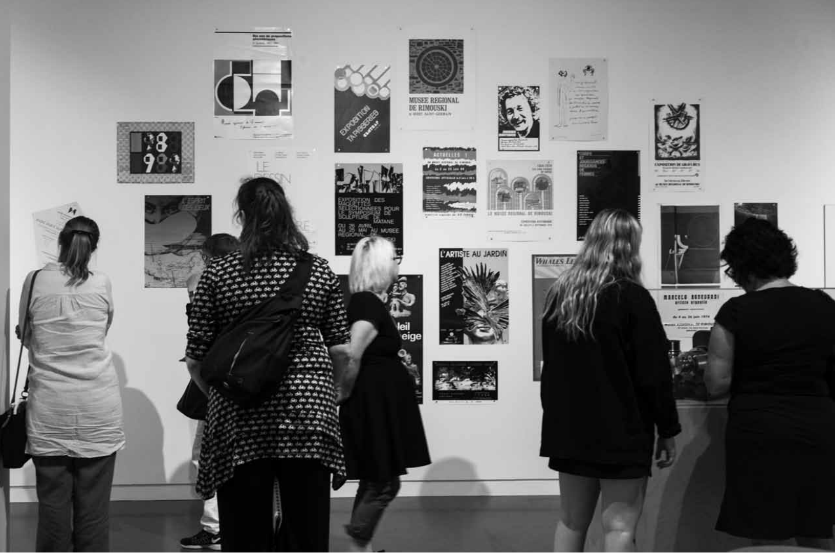
Vue partielle de l'exposition Dialogues dans le temps, le Musée fête ses 50 ans!