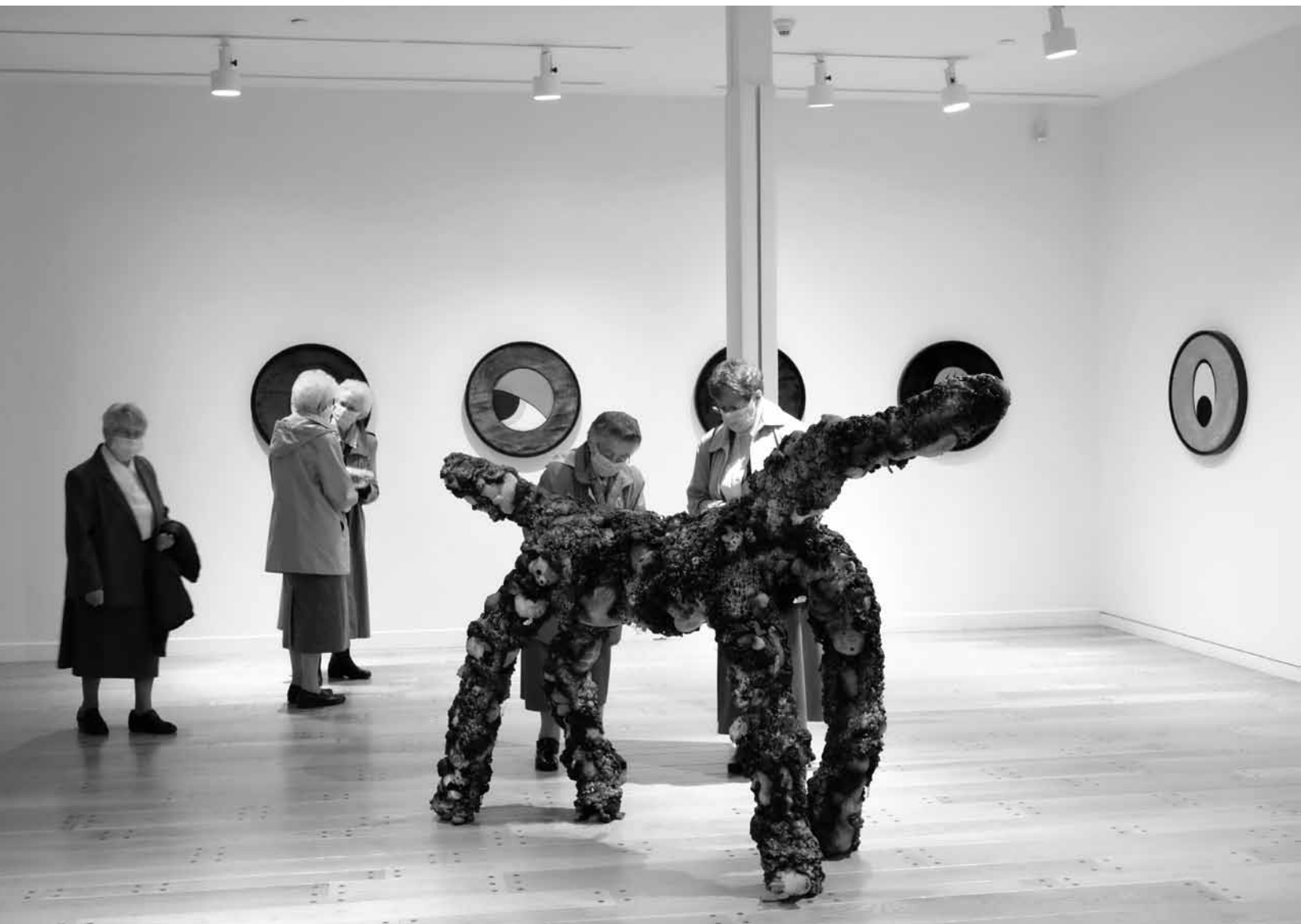
Les religieuses de la congrégation Notre-Dame du Saint-Rosaire en visite dans l'exposition Parmi les monstres de Pierre&Marie.