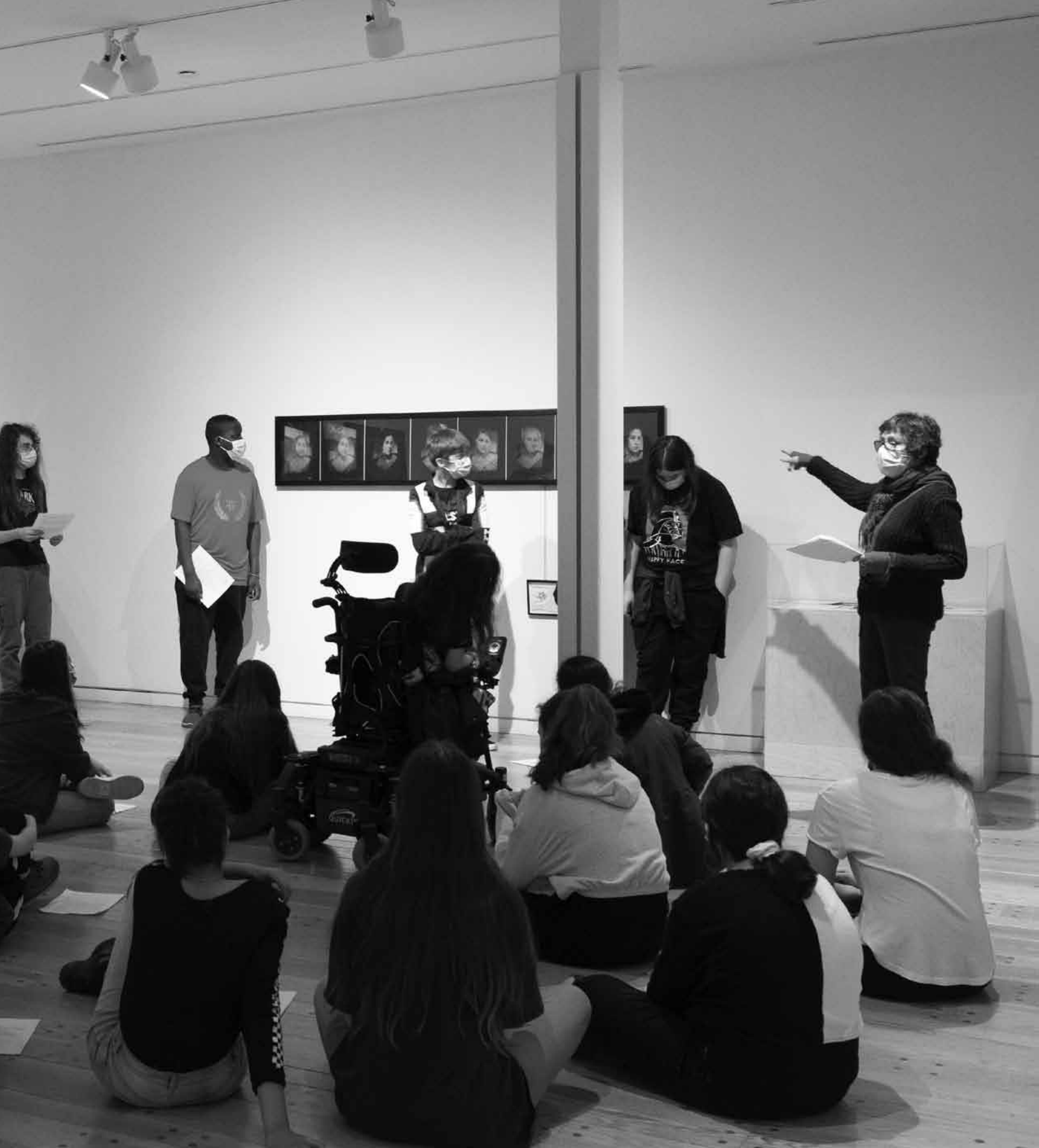
Animation avec un groupe scolaire dans l'exposition Tribune(s) .