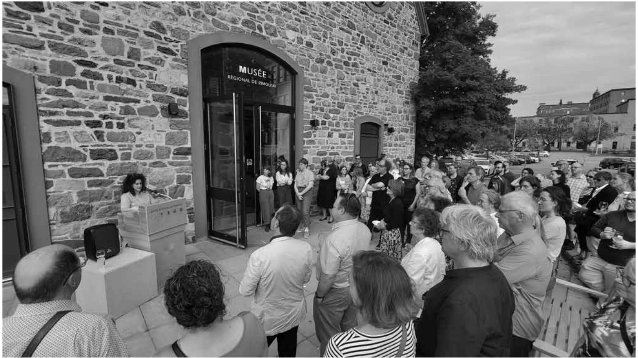
Vernissage de l'exposition Dialogues dans le temps , le Musée fête ses 50 ans!