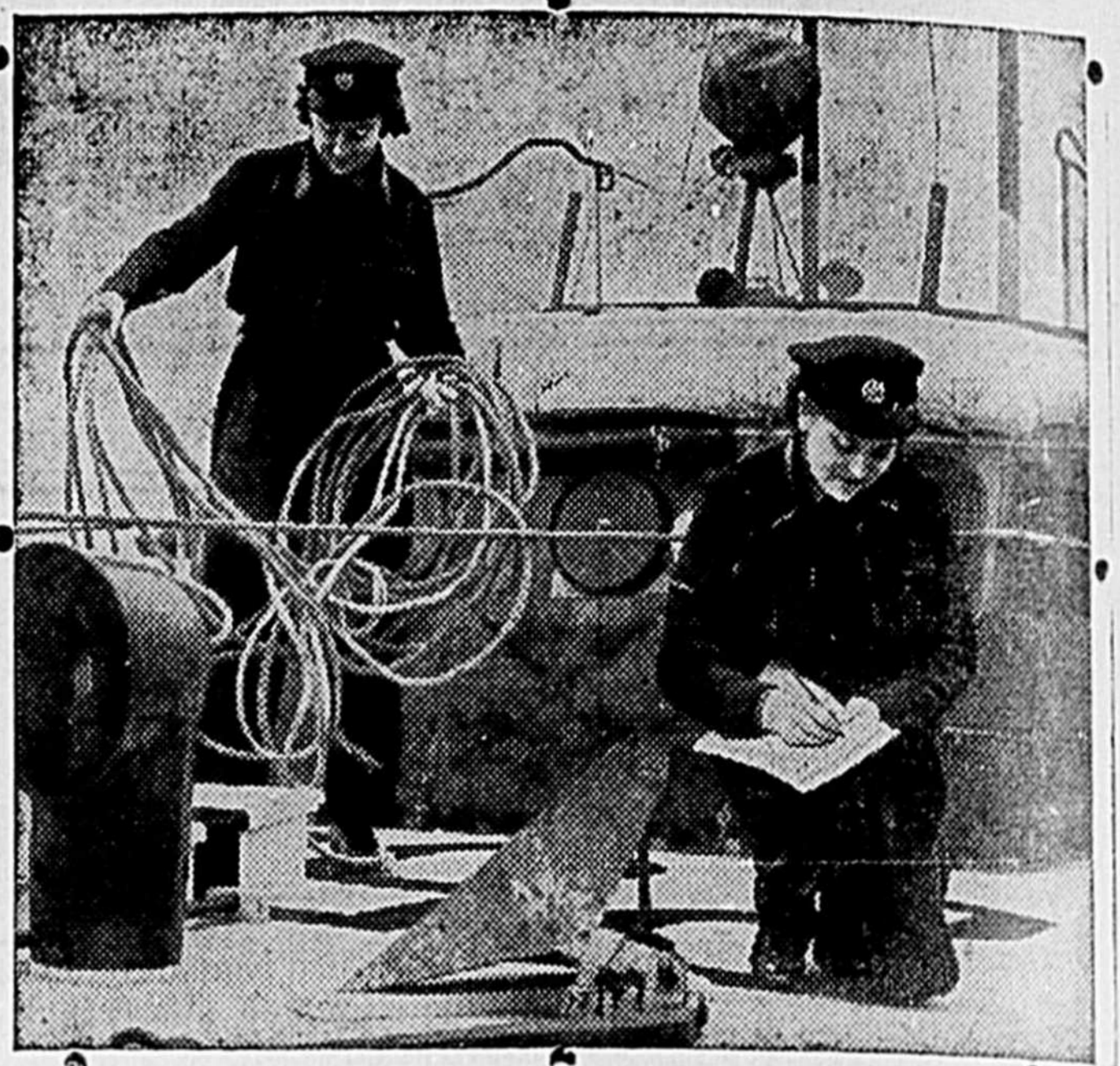
Une des plus importantes fonctions des recrues féminines de la R.A.F. est de procéder à la vérification des nouveaux légers employés par la R.A.F. pour le secours et le rescapage.