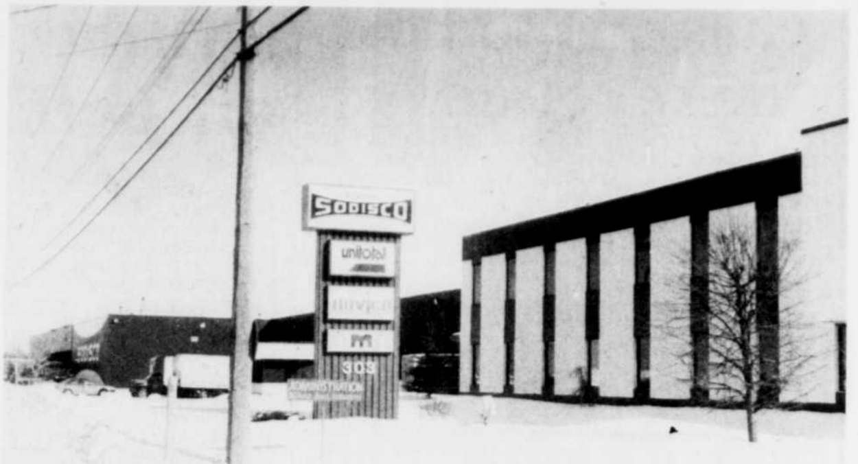
La compagnie Sodisco agrandira de 120,000 pieds carrés ses installations dans le parc industriel de Victoriaville, en 1988.

Pour le président de Sodisco, le point tournant dans l'histoire de l'entreprise est sans doute survenu en 1970 avec l'acquisition d'un ancien associé au début du siècle, l'entreprise A.G. Létourneau. Depuis, la croissance de Sodisco est remarquable.