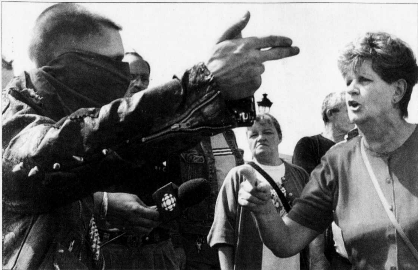
Vive discussion entre un squatteur masqué et une résidante, comme il y en a eu plusieurs hier devant le Centre Préfontaine, à Montréal.