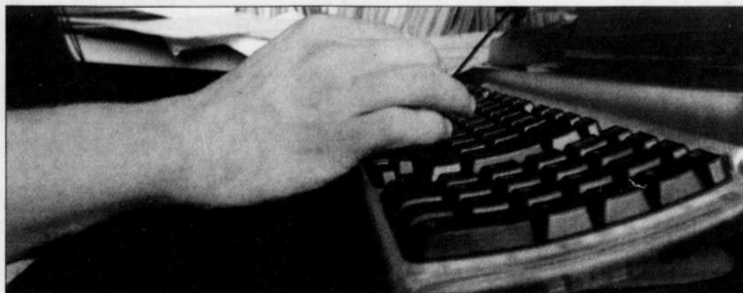
Le stress provoqué par les problèmes personnels finit par coûter cher aux entreprises.