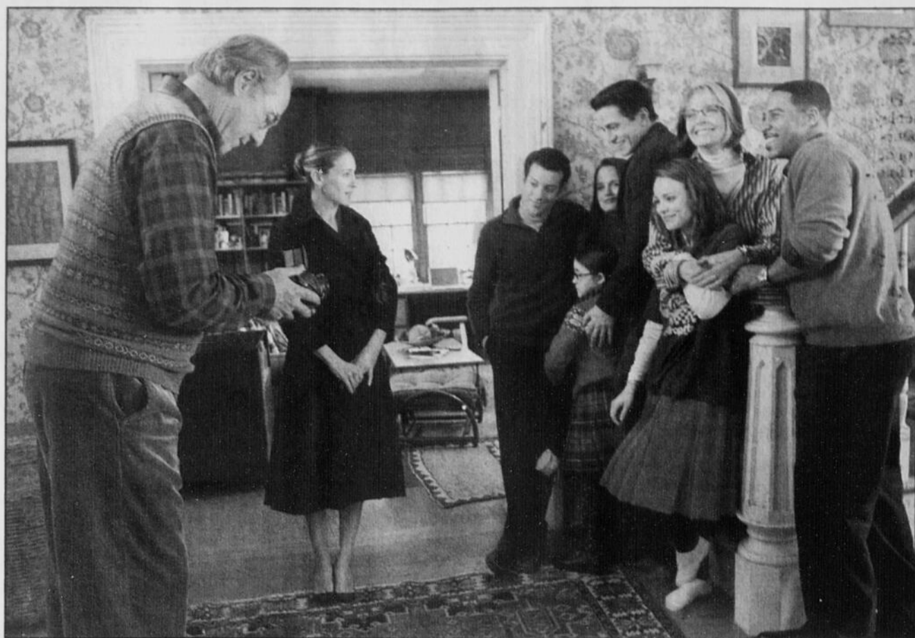
En visite dans la famille «libérale» de son nouvel amoureux, une jeune femme aux valeurs conservatrices provoque de multiples mésaventures. Un portrait un peu surfait, mais quand même sympathique.

Forcément, l'arrivée de Meredith dans le décor aura son effet. Coincée, cette dernière affichera d'ailleurs un vrai talent pour toujours dire la mauvaise phrase au mauvais moment. À vrai dire, les membres de la famille Stone — à commencer par la mère (Diane Keaton) — lui rendront tellement la vie dure qu'elle ne pourra faire autrement que