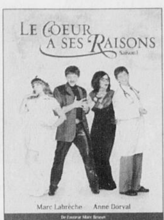
DVD Le cœur à ses raisons TVA Films