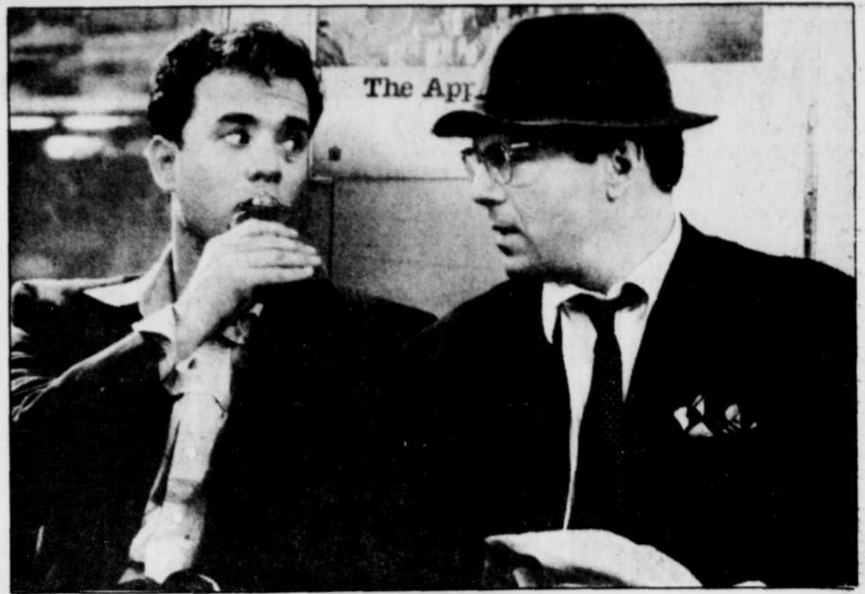
Par sa construction parfaitement symétrique, « Bonfire of the Vanities » fait s'entrecroiser la trajectoire descendante du courtier Sherman McCoy (Tom Hanks, à gauche) et celle, ascendante, du journaliste Peter Fallow (Bruce Willis).

Bonfire of the Vanities a tout d'une dure leçon de choses, à peine camouflée sous les éclats de