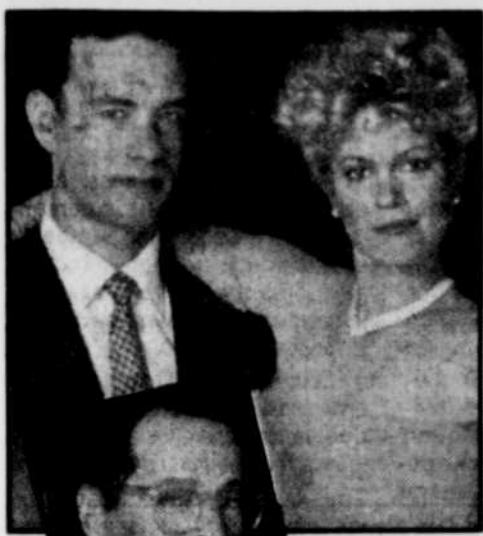
Le dernier Brian De Palma : bravo pour l'audace !

« Bonfire of the Vanities » est une comédie trop vraie pour plaire à tout le monde, d'autant plus que la leçon de choses est sévère. Page 3