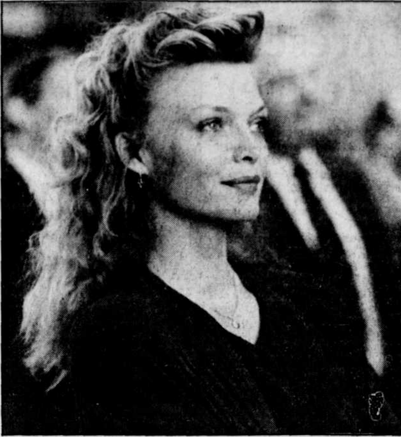
Michelle Pfeiffer fait partie de la distribution du film « The Russia House » présenté en version originale anglaise au cinéma Sainte-Foy.