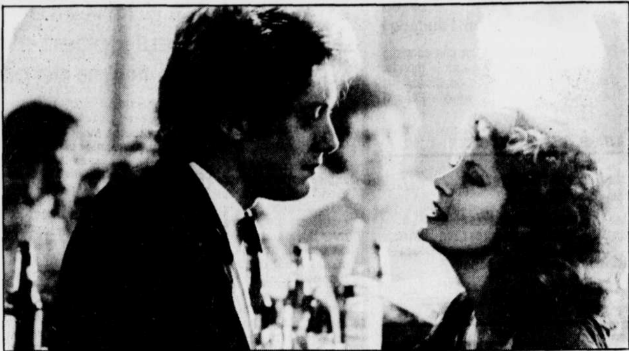
C'est Nora (Susan Sarandon), serveuse au « White Palace », qui drague. Elle a 43 ans et Max (James Spader), 27.

WHITE PALACE. Un film de Luis Mandoki. Scén.: Ted Tally et Alvin Sargent, d'après le roman de Glenn Savan. Phot.: Lajos Koltai. Prod. délégué: Sydney Pollack. Produit par Mark Rosenberg et Amy Robinson. Int.: Susan Sarandon, James Spader, Jason Alexander, Kathy Bates. Au Cinéplex Charest.