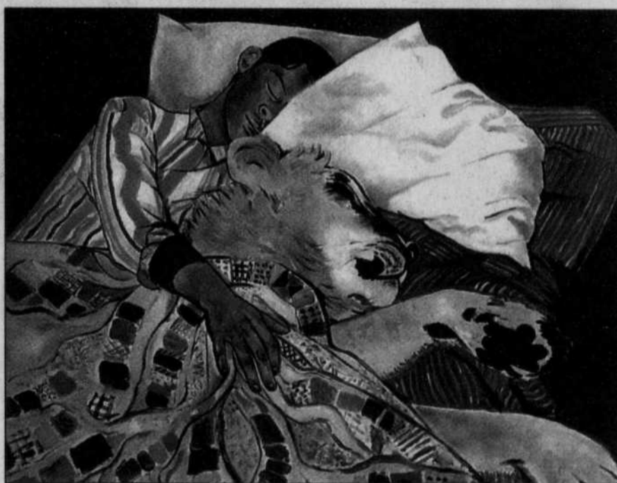
CATALOGUE DE L'EXPOSITION JEAN COCTEAU L'ENFANT TERRIBLE MBAM Sommeil hollywoodien, de Jean Cocteau (1953)