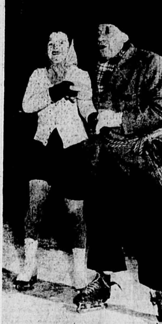
Cette scène a été prise sur le vif, récemment, sur une patinoire montrealaise, où le maire de la ville, Son Honneur M. Camille Houde, s'était rendu pour s'adonner au patinage. M. le maire a sans doute voulu plaire à tous les spectateurs en portant un pantalon à l'Américaine, un veston de tissu anglais, un foulard écossais, un casque russe et une ceinture Péchou canadienne.