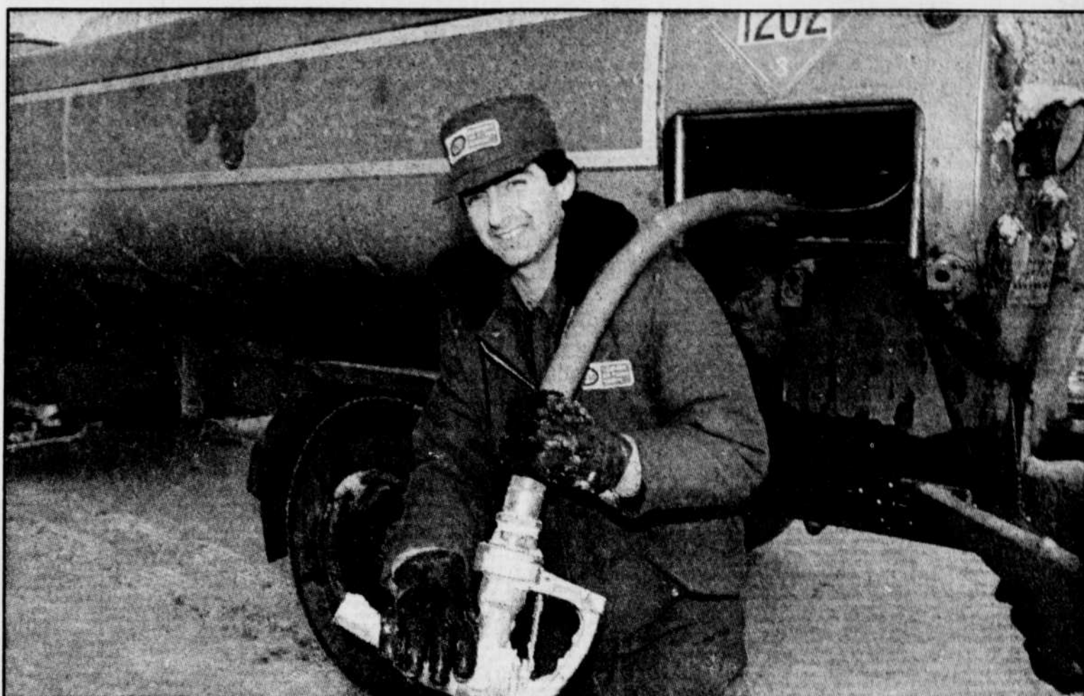
Les camionneurs livrent du mazout 24 heures sur 24, sept jours par semaine.