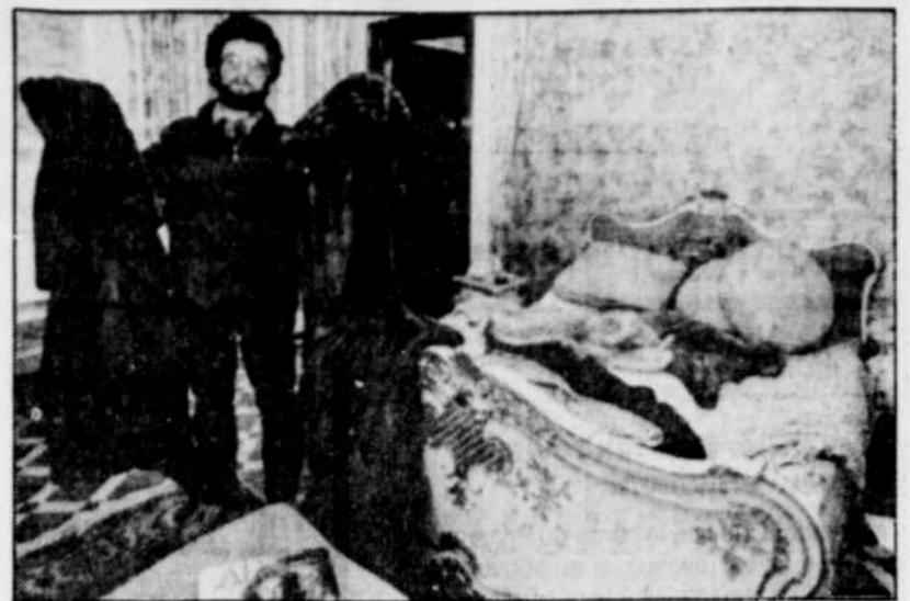
Un Roumain exhibe deux manteaux de fourrure qui appartiennent à Elena Ceausescu.

Confirmation suprême des pouvoirs étendus dont il vient de se doter, le CFSN a décidé que son président sera le véritable numéro un du pays