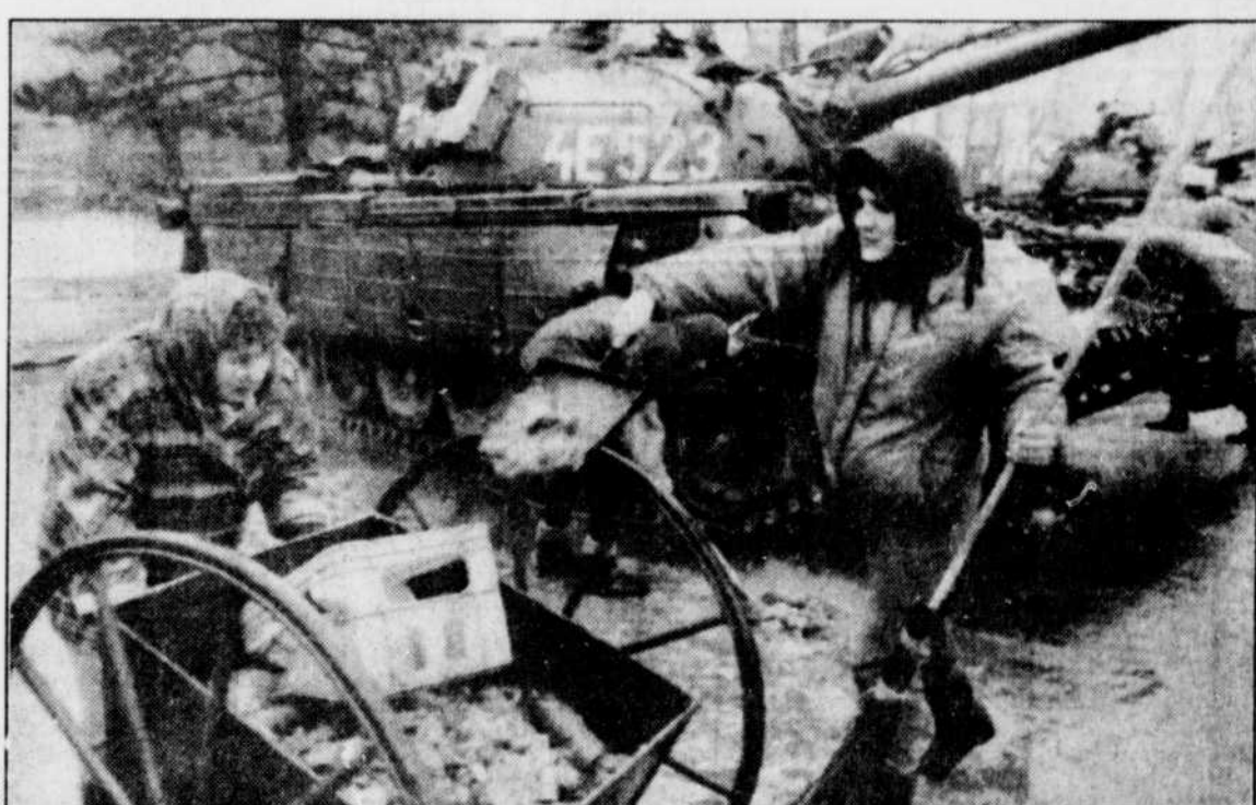
La vie reprend peu à peu son cours normal à Bucarest, où l'on s'affaire notamment à nettoyer les rues.