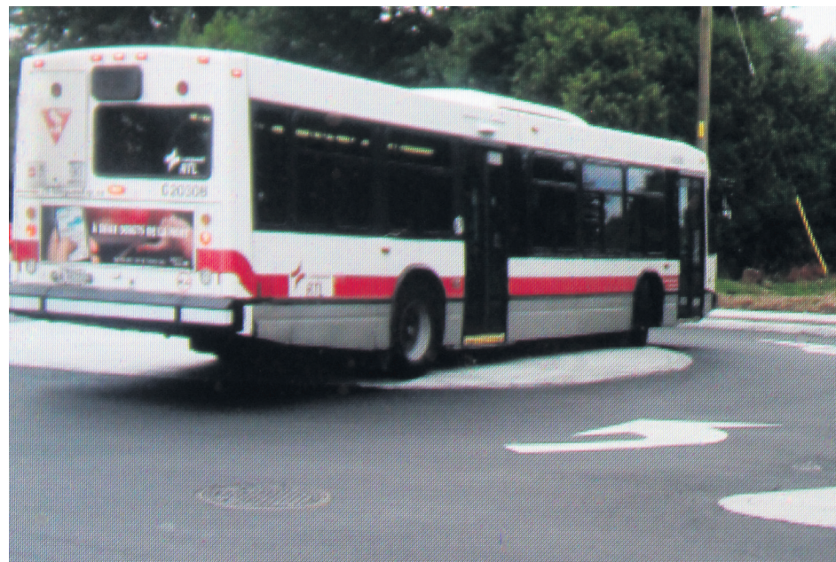
Les autobus et les camions passent sur la dalle de béton.

Dans un sens, ça reflète peut-être sa vision? Ça tourne en rond. »