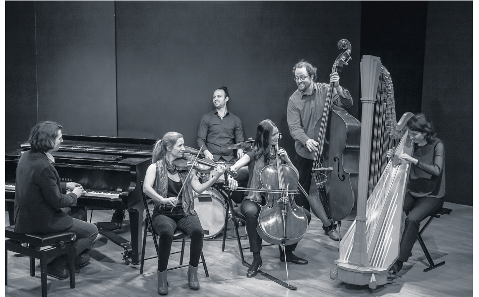
Les musiciens de Cordâme seront de passage à Saint-Bruno-de-Montarville.

Pour célébrer le 150 e anniversaire de naissance d'Érik Satie, les membres de Cordâme ont présenté un concert et un disque ( Satie variations ) dédiés à la musique du compositeur français. Jean-Félix Mailloux a repensé sa musique et s'est inspiré de l'univers de Satie pour écrire les pièces de l'album et créer le spectacle. Il admet cependant que lors de la saison estivale, des changements sont apportés à la production.