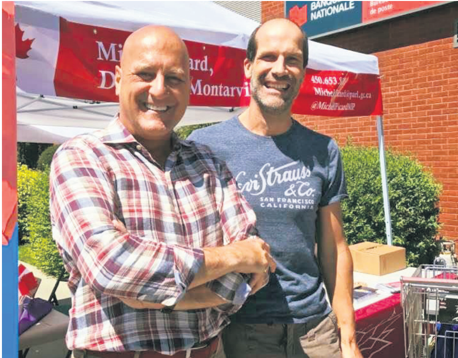
Le député de Montarville, Michel Picard, est allé à la rencontre des citoyens lors de la Journée d'action du Parti libéral du Canada.

Le député de Montarville, Michel Picard, a rencontré les citoyens de sa circonscription le 31 juillet dernier. L'activité avait lieu dans le cadre de la Journée d'action du Parti libéral du Canada.