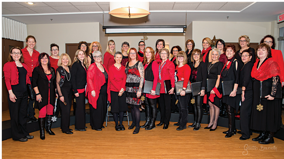
Les membres de Folles harmonies convient la population féminine à venir les rencontrer pour une audition.

Amoureuse du chant, l'ensemble vocal Folles harmonies ouvre sa porte et son chœur et désire vous recruter!