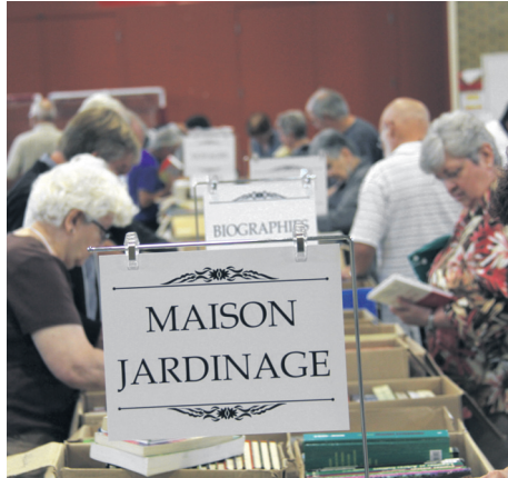
Ces livres proviennent de dons de citoyens et de la bibliothèque Roland-LeBlanc.

M. Pelletier précise que les familles grandbasi-loises et des environs attendent cet événement avec impatience, car on y trouve de tout : livres pour enfants et livres jeunesse, romans, biographies, guides divers... « Où peut-on, de nos jours, trouver de beaux livres pour enfants, des best-sellers souvent comme neufs, des guides de voyage, des livres de cuisine ou des livres rares à des prix variant de 0,50 $ à 2 $? Avec quelques dollars, les acheteurs auront tôt fait de garnir leur bibliothèque. »