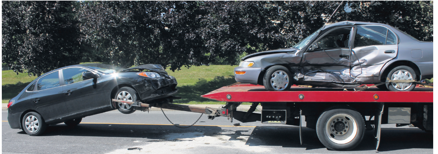
Un accident impliquant deux voitures est survenu rue De Chambly à Saint-Bruno-de-Montarville.

« La cause de l'accident semble être, pour le moment, une mauvaise analyse de demi-tour sans s'assurer d'absence de danger. Est-ce que la vitesse était en cause? Ça reste à déterminer », a répondu au journal Les Versants le sergent Giroux, du Service de police de l'agglomération de Longueuil.