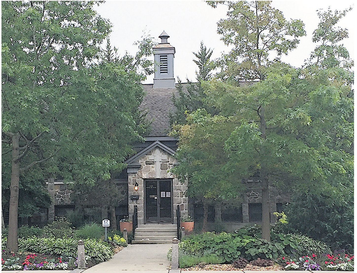
Bien que les maires suppléants n'aient pas de calendrier précis, ils sont un peu plus sollicités à remplacer le maire en été.