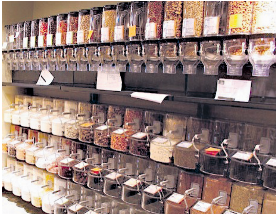
Les gens vont aux épiceries en vrac pour réduire le gaspillage, leurs dépenses, ainsi que pour encourager l'économie locale.

Un autre principe du vrac, c'est de réduire le gaspillage. Fini les emballages en plastique, on convoite plutôt les contenants réutilisables. De