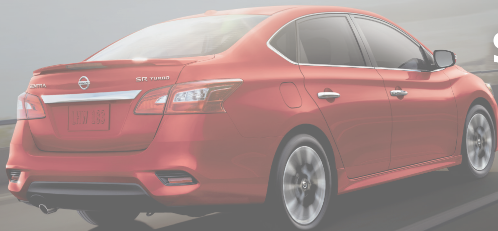
Sentra SR turbo illustrée #