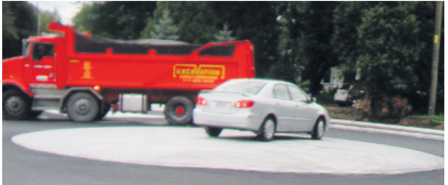
Même les voitures circulent sur la dalle de béton.

Enfin, Jean-Pierre Hotte estime que le carrefour giratoire est une « solution de plusieurs millions de dollars totalement inutile ». « Si cela "représente l'avenir", comme le prétend le maire Martin Murray, ça n'augure rien de bon pour le futur de Saint-Bruno-de-Montarville.