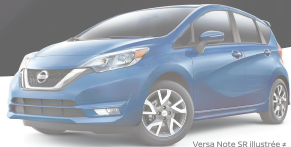
Versa Note SR illustrée #

DE RABAIS EN ESPÈCES SUR TOUS LES MODÈLES ÉQUIPÉS DU SYSTÈME DE FREINAGE D'URGENCE