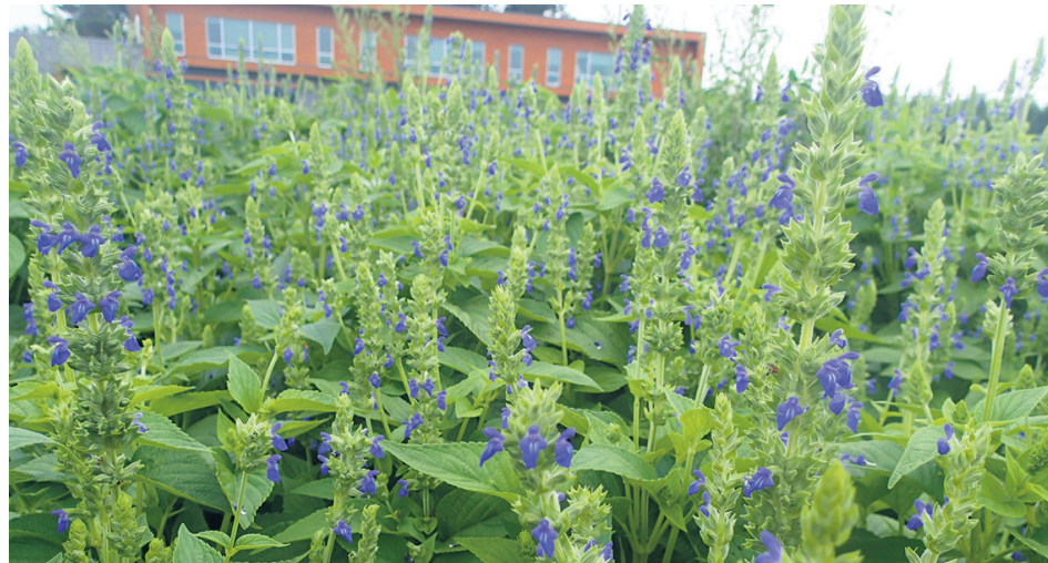
Selon les recherches de l'IRDA, le chia pourrait être produit au Québec.

Dans ce projet, les chercheurs déterminent les meilleures pratiques pour réussir à cultiver le chia. Ils s'interrogent sur l'impact de la date de semis et les taux de semis. Le semis est l'opération qui consiste à l'ensemencement des champs. « La date de semis est importante, car