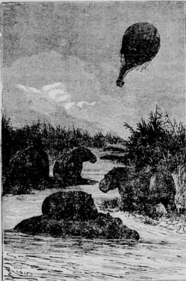
LES HIPPOPOTAMES A LA SURFACE DES ÉTANGS

—L'atmosphère est chargée d'électricité, répondit le docteur ;