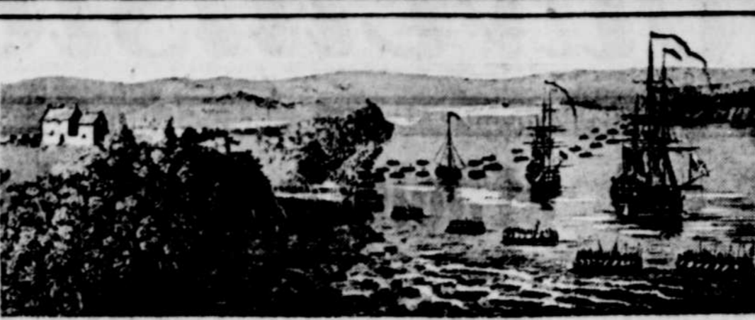
1. En haut: Reconstitution du débrisement du troupeau de la Vieille l'Anse-au-Foulon, d'après une vieille gravure. 2. En bas, à droite: l'entrée du nouveau tunnel du Pacifique Canadien, du côté du fleuve, dont on achève actuellement la construction. 3. En bas, à gauche: Le tunnel de la Vieille l'Anse-au-Foulon, le village de l'Anse-au-Foulon, en 1795.

A venue prochaine du luxueux paquebot de 42,800 tonnes du Pacifique Canadien, l'Empress of Britain, à Québec, marquera une époque mémorable dans les annales maritimes de la province de Québec. Le puissant navire, qui sera le plus gros à remonter le fleuve, accostera le 2 juin prochain aux nouveaux quais à eau profonde de la compagnie, évitant un détour considérable par le terminus de Québec et raccourcira sensiblement le trajet entre les quais et les principaux centres canadiens et américains.