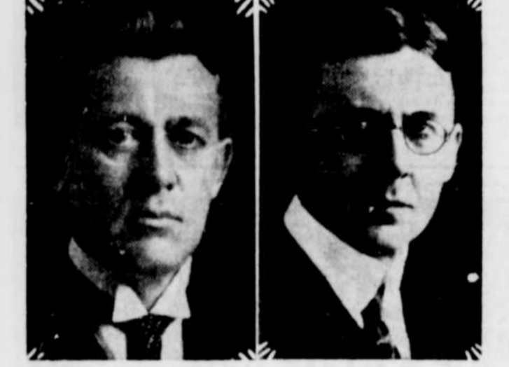
Le premier ministre J. T. M. Anderson, de la Saskatchewan (à gauche) et le premier ministre Brownlee, de l'Alberta qui doivent avoir une conférence sur la situation du grain. Ce sont eux qui feront le choix de la représentation de l'ouest sur la future commission qui doit s'occuper de la situation du grain au Canada.