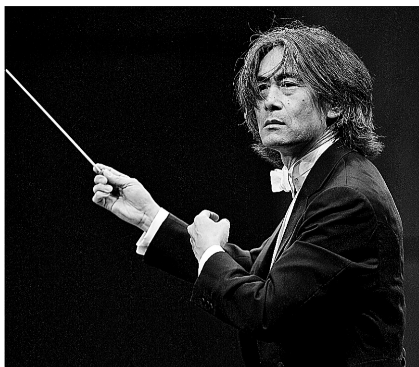
Kent Nagano à l'OSM : concerts, dévoilement et tournée.