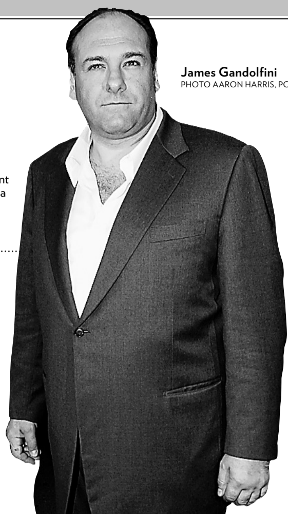
James Gandolfini

L'acteur Leonardo DiCaprio serait sur le point de signer un contrat à New York... Pas pour faire des stepettes à Broadway, mais pour se mettre dans la peau d'un personnage déjà joué par Al Pacino il y a 30 ans, dans un des nombreux théâtres de la Grosse Pomme. DiCaprio incarnerait Pavlo Hummel, un soldat américain posté au Vietnam, dans The Basic Training of Pavlo Hummel . S'il signe le contrat qu'on lui offre, M. Titanic s'installera à New York à l'automne, tout de suite après le tournage de Revolutionary Road , de Sam Mendes. La pièce dénonce la guerre et ses horreurs, le film traite du poids du conformisme dans la société américaine... DiCaprio tenterait-il d'envoyer un message à ses concitoyens?