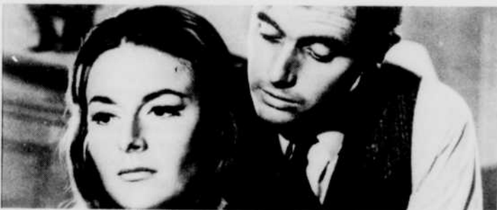
Les Hommes de Las Vegas