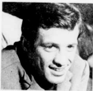
Jean-Paul Belmondo et Emmanuelle Riva, vedettes de "Léon Morin, prêtre", jeudi à 1 h. 05.

3.45—Femme d'aujourd'hui 4.45—La Boîte à Surprise 5.15—Les Croquignoles 5.45—Jeunesse oblige "La Boîte à chansons". La tournée de Jean-Pierre Ferland. Invité: Raoul Roy, A Vancouver. 6.15—Téléjournal 6.30—Roquet, belles oreilles 7.00—Aujourd'hui 8.00—Tous pour un 8.30—Rocambole 9.00—Sextant La peine capitale (1re émission). 9.30—Deux millions de femmes L'homme face au travail des femmes mariées. 10.00—Michel Legrand 11.00—Théâtre Dick Powell