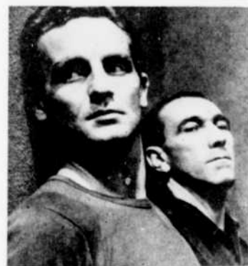
"Le Trou" de Jacques Becker, samedi soir à 11 h. 30.