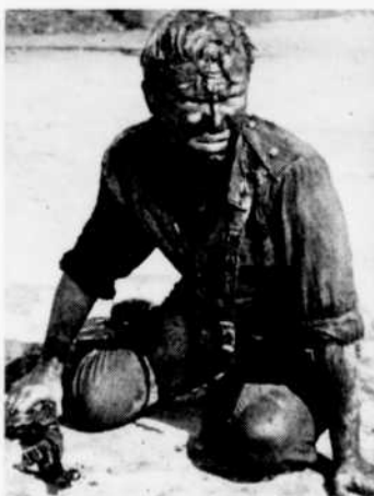
"Ils aimaient la vie"