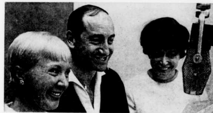
"Toute la gamme"