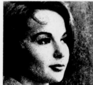
Françoise Arnoul et Jean Gabin, dans "Des gens sans importance", au "Cinéma" de vendredi soir à 11 h. 30.