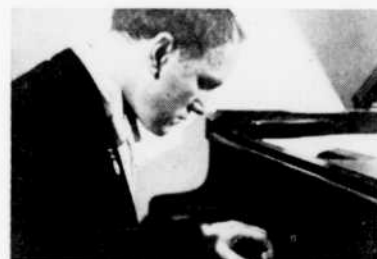
Sviatoslav Richter, à "Musique de piano", vendredi à 8 heures.