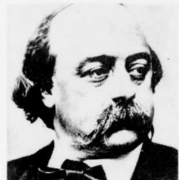
"Madame Bovary" de Gustave Flaubert, à l'étude dimanche soir à 6 h. 30.

10.40—Tour des capitales Interprétation d'une question d'actualité au pays ou à l'étranger. 10.55—Nouvelles du sport 11.00—Le Cabaret du soir qui penche Avec Guy Mauffette. CBAF—Détente 11.25—CBAF—Météo et fin des émissions 12.00—Radiojournal CBJ—Fin des émissions 12.02—Musique variée CJBC—Fin des émissions