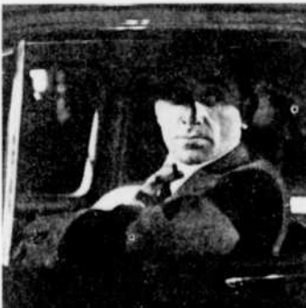
"Horace 62", au "Cinéma de Paris".

11.30—Les Incorruptibles "Cinq contre un". Cinq frères enlèvent un puissant gangster et exigent une rançon de ses comparses.