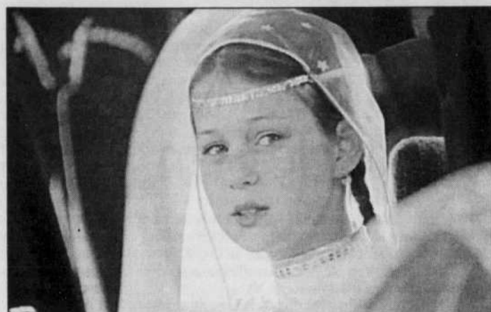
Danse, Grozny, danse , du Néerlandais Jos de Putter.

Lors de la cérémonie de clôture qui s'est tenue hier, le film La Délivrance de Tolstoy , une œuvre signée par l'homme de lettres fran-