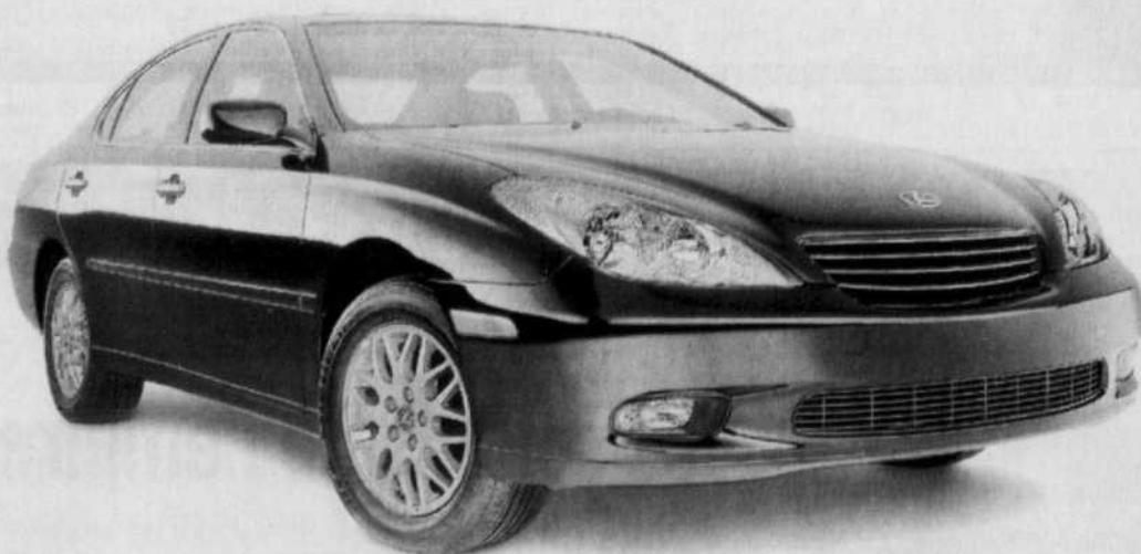
ES 330 SPORTDESIGN

LA NOUVELLE ES 330 2004 PAR MOIS : 499 $* PRIX À PARTIR DE : 43 800 $*