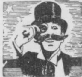
— PAR — L'ACADEMICIEN