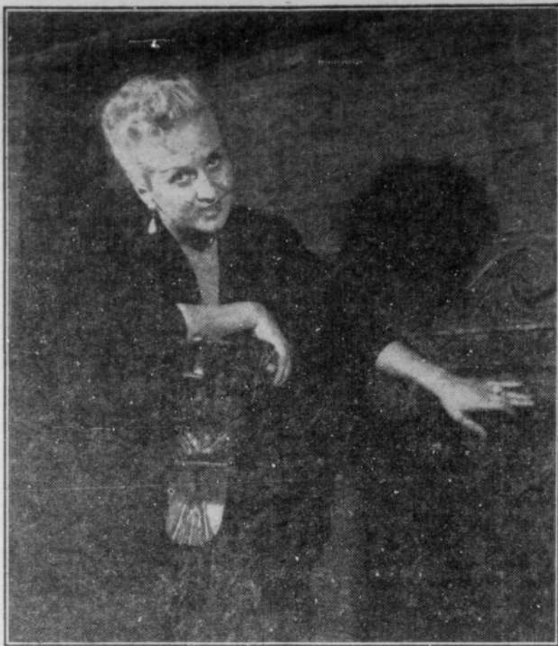
Grande artiste, MARIANNE MICHEL est aussi femme d'intérieur. Elle collectionne les objets précieux et son foyer est un véritable chef-d'oeuvre de goût et d'art.