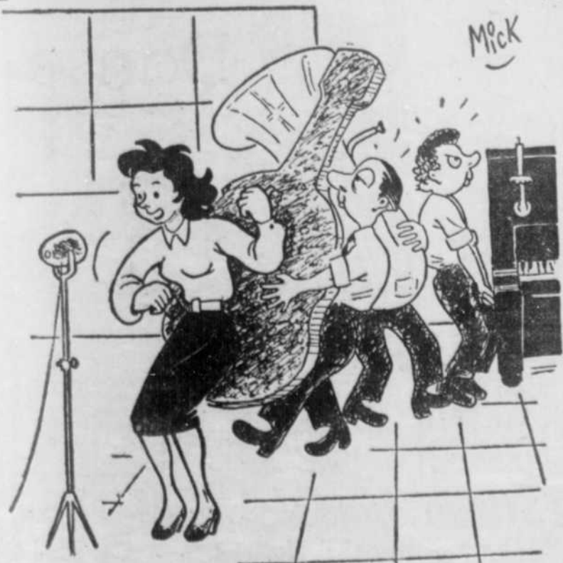
(à propos) . . . "Dans quelques instants, vous entendrez notre concert de musique légère..."