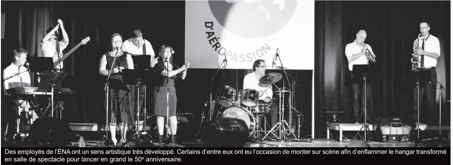
Des employés de l'ÉNA ont un sens artistique très développé. Certains d'entre eux ont eu l'occasion de monter sur scène afin d'enflammer le hangar transformé en salle de spectacle pour lancer en grand le 50 e anniversaire.

Il y a 50 ans, l'École nationale d'aérotechnique, qui portait alors le nom d'Institut aérotechnique du Québec, recevait ses quelque 75 premiers étudiants, tous des garçons. Les célébrations de cet anniversaire ont été lancées lors du traditionnel discours de la rentrée suivi de l'hommage aux retraités, qui s'est exceptionnellement tenu dans un hangar de l'ÉNA. Cet impressionnant événement mettait en vedette plusieurs enseignants, dont certains à la retraite, des étudiants et des diplômés.