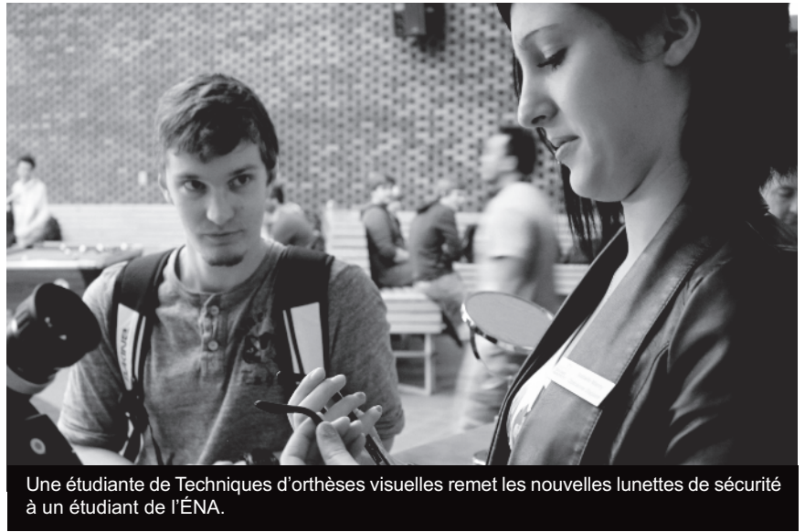
Une étudiante de Techniques d'orthèses visuelles remet les nouvelles lunettes de sécurité à un étudiant de l'ÉNA.