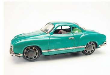
On trouve aussi plusieurs voiturettes, dont une Volvo datant de 1962.