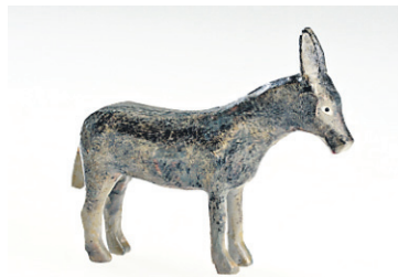
Plusieurs petits animaux se trouvent dans « l'escalier ».

On trouve 25 poupées différentes à l'exposition: la poupée bout'chou, la poupée en chiffon grandeur nature des années 70 et la dernière de l'heure, une poupée orange qui fera apparemment fureur à Noël. En prime: une poupée inuit, une poupée ethnique et des poupées victorienne, en porcelaine, avec de véritables cheveux humains, datant de 1875.