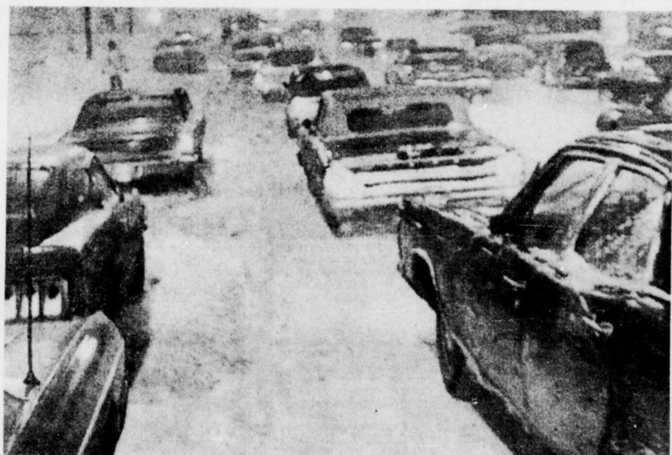
De longues files d'autos ont été immobilisées, hier, dans les rues de Montréal, comme un peu partout dans le reste de la province, par une nouvelle chute de neige accompagnée de vents forts qui, d'après les prédictions, ne serait que le début d'une tempête de deux jours devant laisser tomber de neige sur une grande partie du Québec. Un avertissement a été lancé à tous les automobilistes leur signalant que la plupart des routes sont dangereuses.

Toutefois, à Dorval, hier, on mentionnait que les vols étaient maintenus mais que quelques liaisons internationales avaient été détournées par mesure de sécurité.