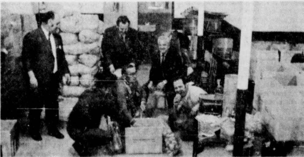
14,000 LIVRES DE VICTUALLES — Les Chevaliers de Colomb de Granby procédaient en fin de semaine à la distribution de boîtes de Noël aux familles déshéritées de notre ville. Grâce à la générosité du public pour répondre à l'appel des Chevaliers, 250 familles se sont ainsi partagées pas moins de 14,000 livres de victualles de toutes sortes. On voit ici quelques membres des Chevaliers de Colomb, au moment de la préparation des boîtes, dont la distribution a eu lieu dimanche après-midi.

La population est aussi informée qu'il y a maintenant un officier à sa disposition le mercredi de chaque semaine à la Chambre 204, au 150 rue St-Jean, c'est-à-dire au deuxième étage de l'Edifice Fédéral. L'on peut aussi appeler directement au bureau de Sherbrooke sans aucun frais interurbain en signalant 478-2578.