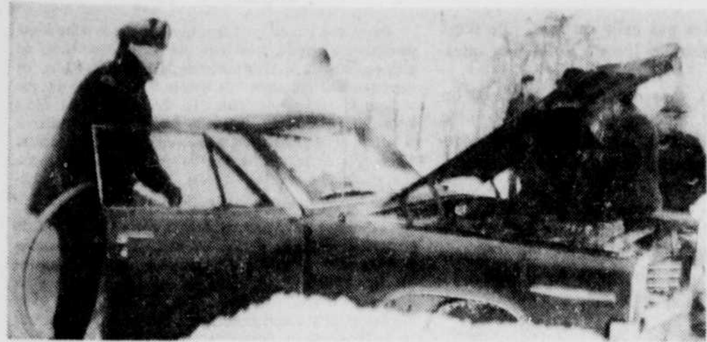
PERTE TOTALE — Un citoyen de St-Charles, M. Onésime Jutras, a vu son automobile être la proie des flammes hier après-midi vers quatre heures sur la rue Du Pont à Drummondville. Le service des incendies de Drummondville a dépeché un camion sur les lieux mais l'automobile est considérée comme une perte totale.