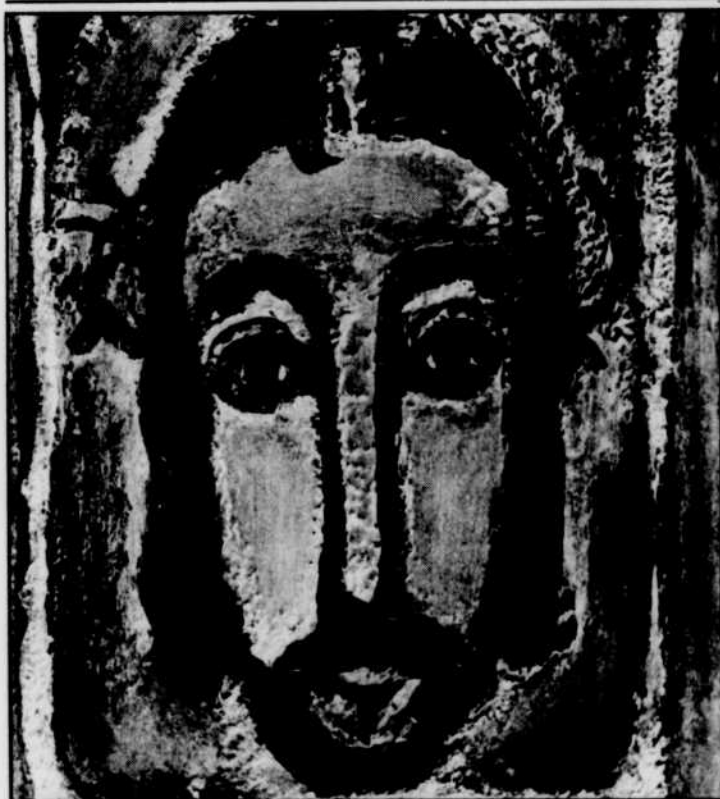
La Sainte Face, de Rouault