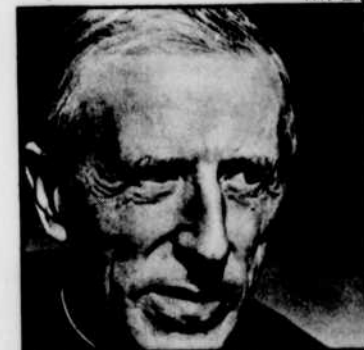
R.P. TEILHARD DE CHARDIN