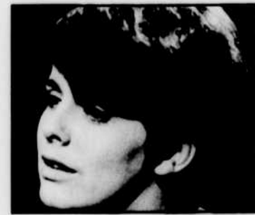
La chanteuse Odette OLIVIER interprétera quelques-uns de ses succès, à «Place aux femmes», à 14 h 30.