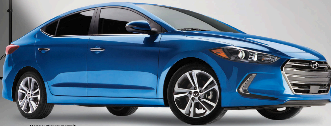
Modèle Ultimate montré*