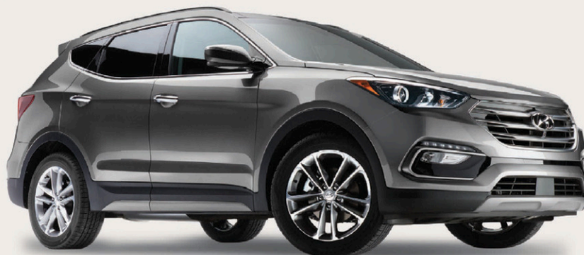
Modèle Ultimate montré*