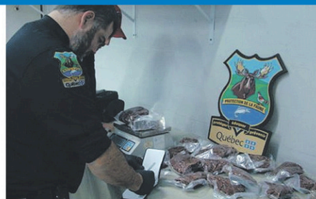
La viande saisie sera remise à des organismes communautaires afin d'alimenter des gens dans le besoin.

La viande qui a été retrouvée par les agents de protection de la faune sera remise à des organismes communautaires.