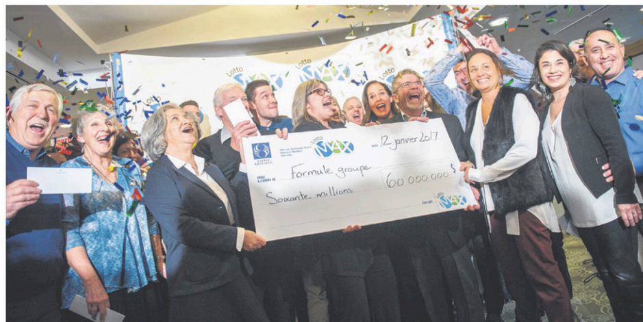
Les gagnants du 60 M$ de Lotto Max.