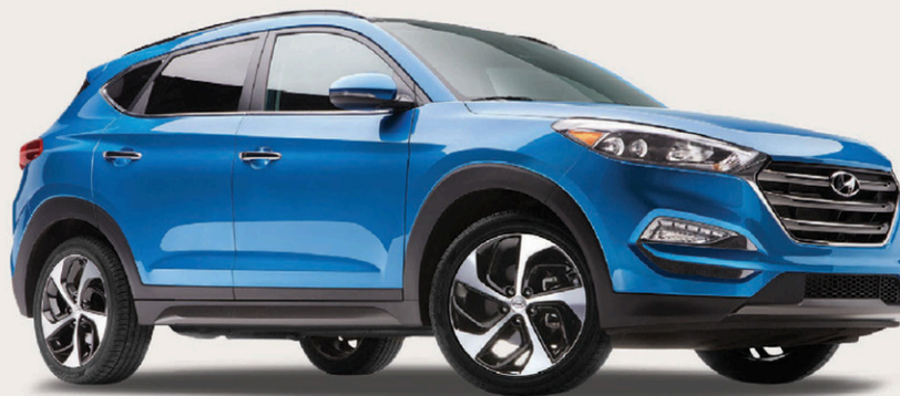
Modèle Ultimate montré*