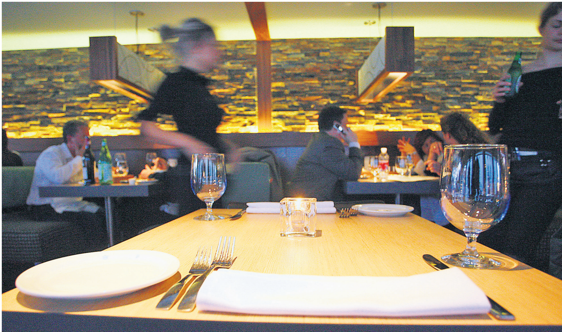
L'appartement accueille les jeunes branchés de la Cité du multimédia.