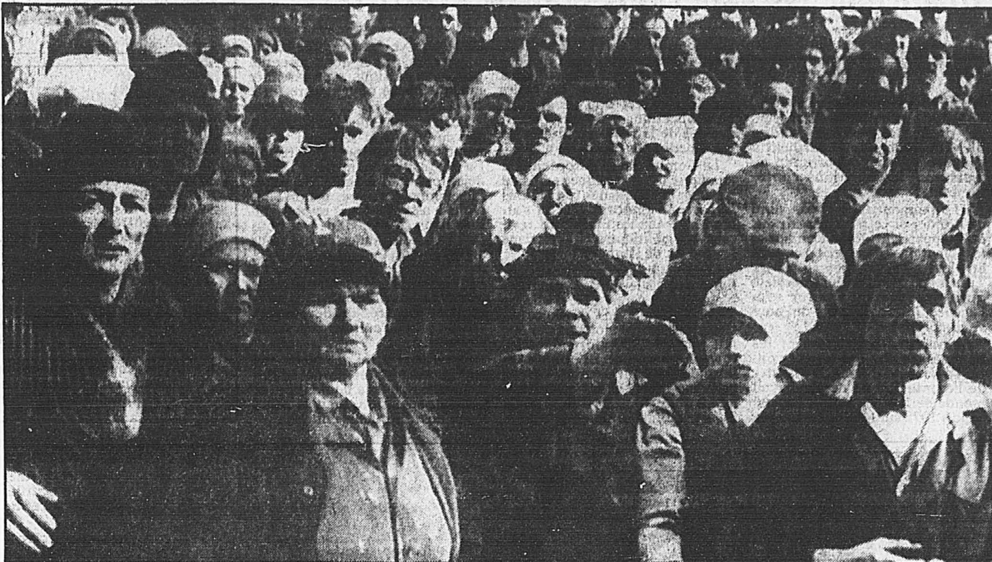
Dans leur lutte, les mineurs soviétiques ont reçu l'appui d'autres travailleurs qui réclament eux aussi la démission de Mikhaïl Gorbatchev.

PAULE ROBITAILLE collaboration spéciale DONETSK, Ukraine