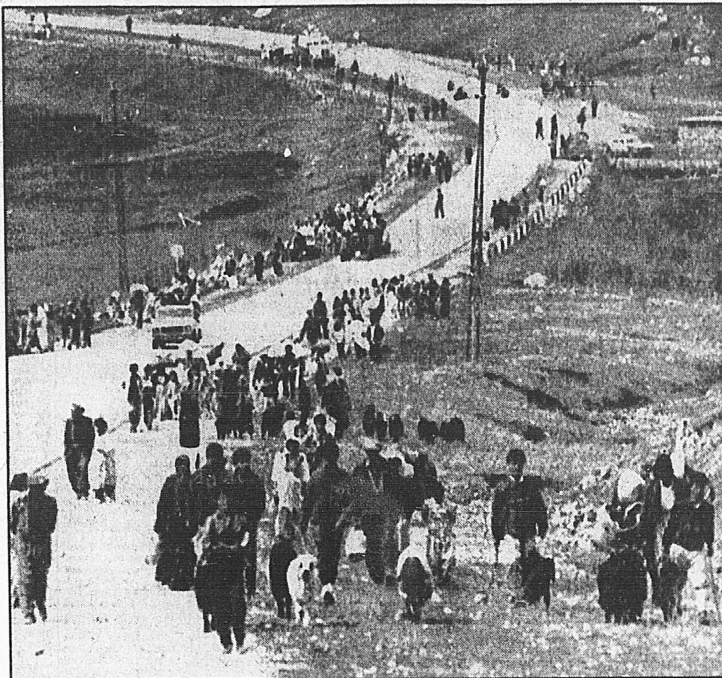
Ces réfugiés de la ville de Dohuk se dirigent vers les montagnes du nord de l'Irak pour tenter de passer en Turquie.

L'Irak a par ailleurs accordé une amnistie à tous les déserteurs détenus dans la région de Zakho par les insurgés kurdes, selon l'INA.