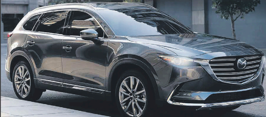
MAZDA CX 9 2019 AVEC MOTEUR TURBO 2,5L

UN CRÉDIT POUR 4 PNEUS D'HIVER DE 1 000 $ +