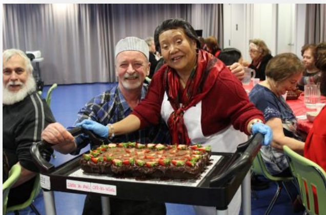
Un grand gâteau au chocolat