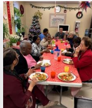
À l'HLM Place Newman, cuisiner est une affaire collective. Une bonne poignée de résidents s'implique dans la cuisine, le service et le nettoyage. Puis, à table pour déguster un repas succulent dans une salle décorée de belles plantes.