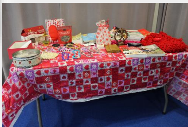
Table de cadeaux