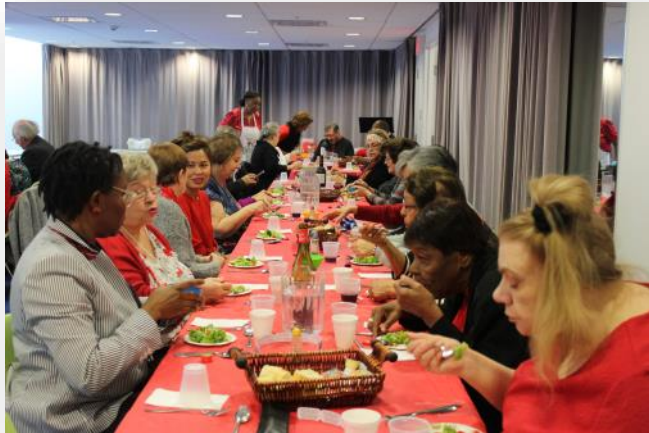
Décoration en rouge