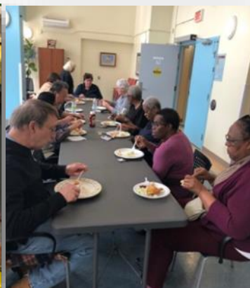
Un menu santé :3 variétés de délicieuses salades, concocté par des chefs ! Les participants les savourent ! (HLM Goyer)