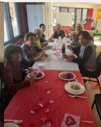
L'HLM Plamondon souligne le St-Valentin avec un repas décoré de cœurs. Une aînée venue du coin met la main à la pâte. Que c'est magnifique !