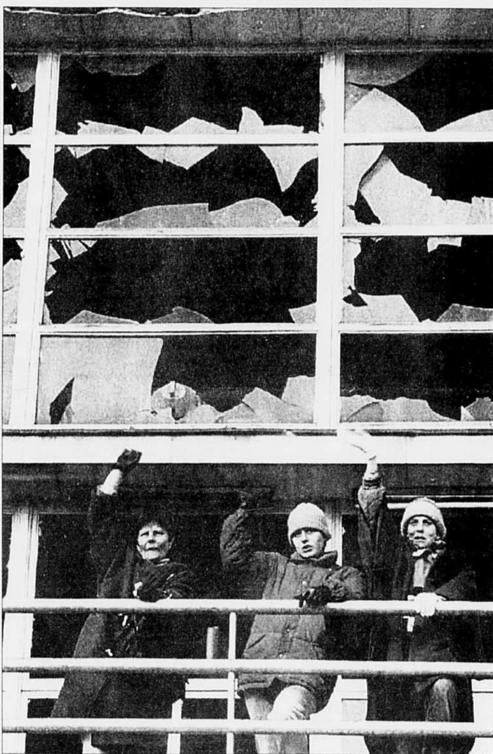
CES TROIS FEMMES disent au revoir à des proches qui ont été évacués hier de la ville martyre de Sarajevo. Un millier de personnes ont ainsi quitté la capitale bosniaque. Plus d'informations en page A 5.