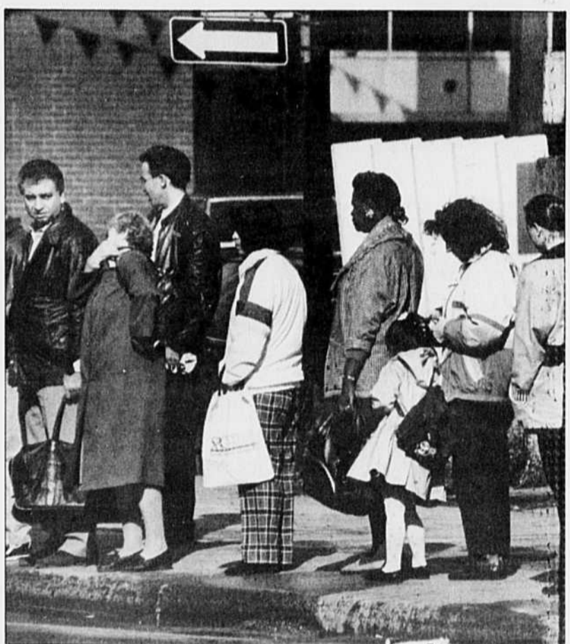
Le boulevard St-Laurent est demeuré depuis des décennies le coeur de la présence ethnoculturelle à Montréal.

L'Autre Montréal a été créé en 1983, mais son origine remonte aux années 70, alors que le Comité de logement Saint-Louis réunissait des gens pour offrir une formation sur