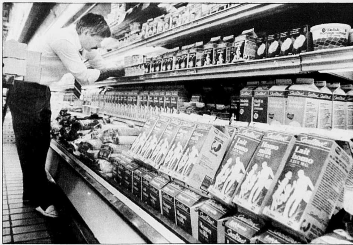
Avec ses 15 600 fermes laitières, le Québec occupe le premier rang au Canada et possède 47 % du quota national.

Quant au beurre, sa consommation continue de diminuer ayant chuté de 28 % de 1970 à 1978 affichant par la suite une baisse de 7 % par an-