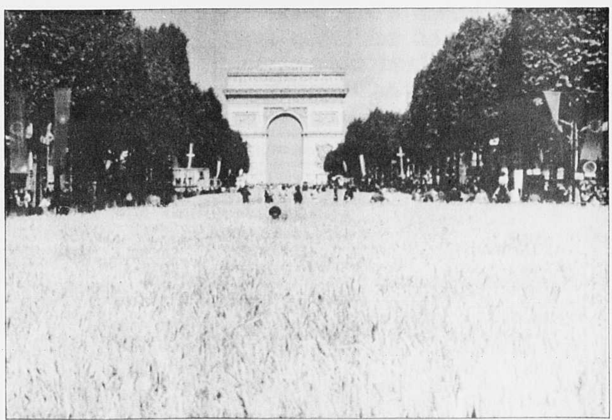
Les fermiers ont envahi les Champs-Élysées dimanche dernier pour y faire les foins.

Notons également la tendance, qui devrait s'accroître, à un retour de la société centripète, autrement dit à la recherche de l'intégration de tous