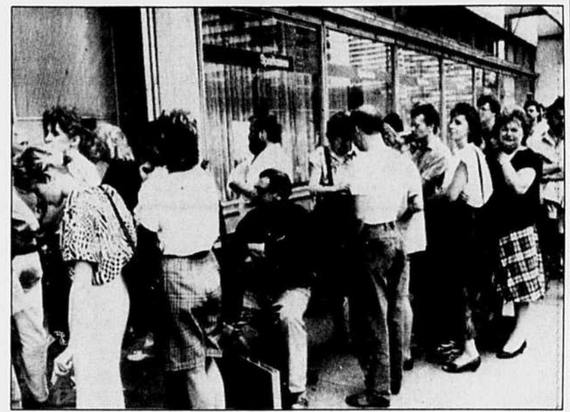
Les Allemands de l'Est faisaient la queue, hier, pour échanger leurs devises contre des marks.

Fustigeant les nationalismes exacerbés, M. Markovic a rappelé que la stabilité intérieure et l'ouverture sur le monde « sont le seul visa pour une entrée en Europe » où personne ne veut voir de « nouveaux conflits locaux, violences, et encore moins de redécoupage des frontières ».