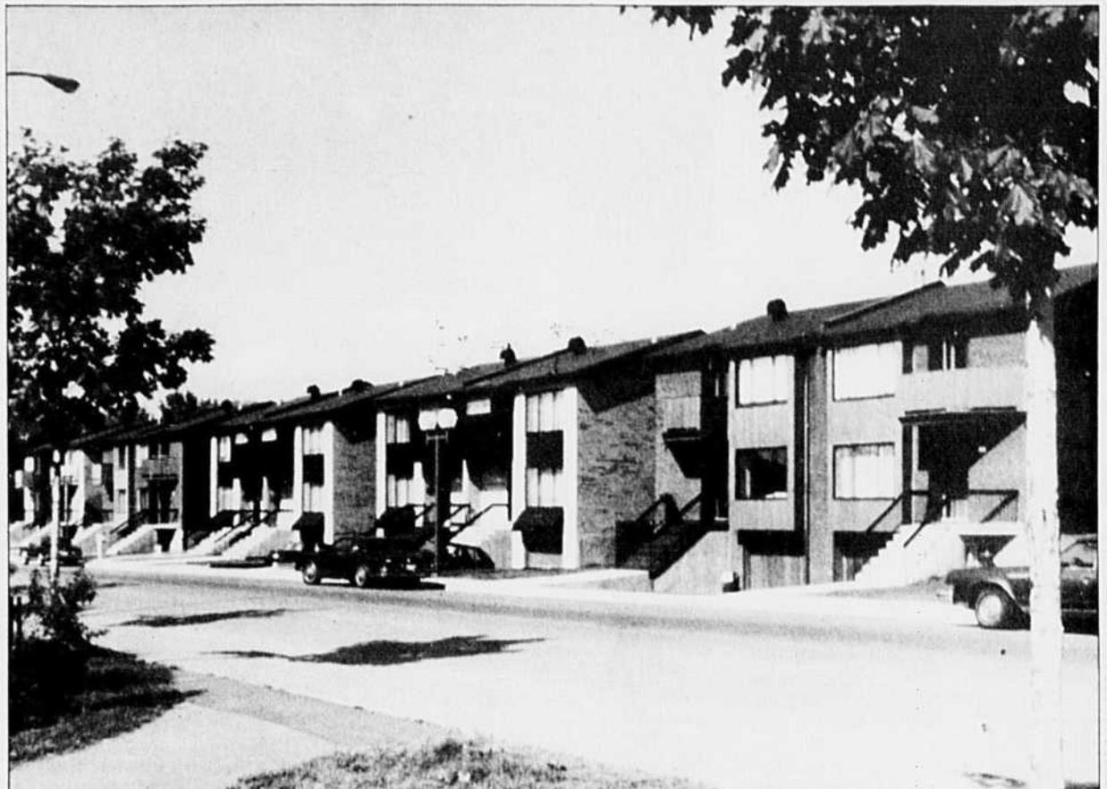
Le nombre des acheteurs d'une première maison a enregistré une hausse de 3 % récemment. Ils représentent maintenant 45 % du marché.

Symbole de cette résistance évoquée plus haut, la valeur moyenne de la maison individuelle à 2 étages, de catégorie luxe, a conservé, dans le meilleur des cas, le lustre qu'elle avait l'an dernier. À Notre-Dame-de-Grâce (275 000 $), Outremont