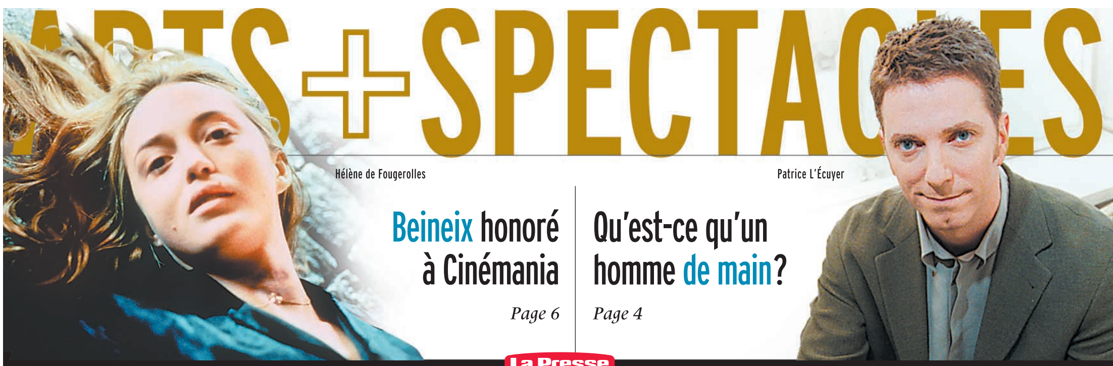
Hélène de Fougerolles