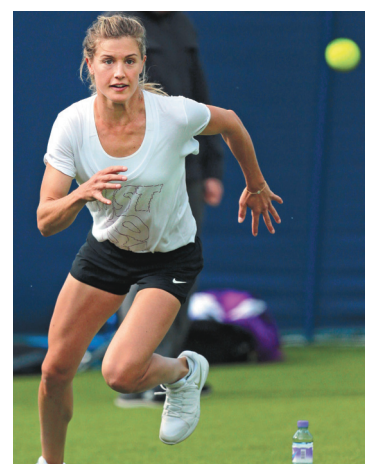
Eugénie Bouchard pendant son entraînement au tournoi de tennis d'Eastbourne

Classée 7 e tête de série, Bouchard fera face à l'Américaine Alison Riske, 42 e au classement WTA et victorieuse au premier tour de la Française Alizé Cornet au compte de 6-0 et 6-3. Ce match devait avoir lieu lundi mais il a dû être reporté à