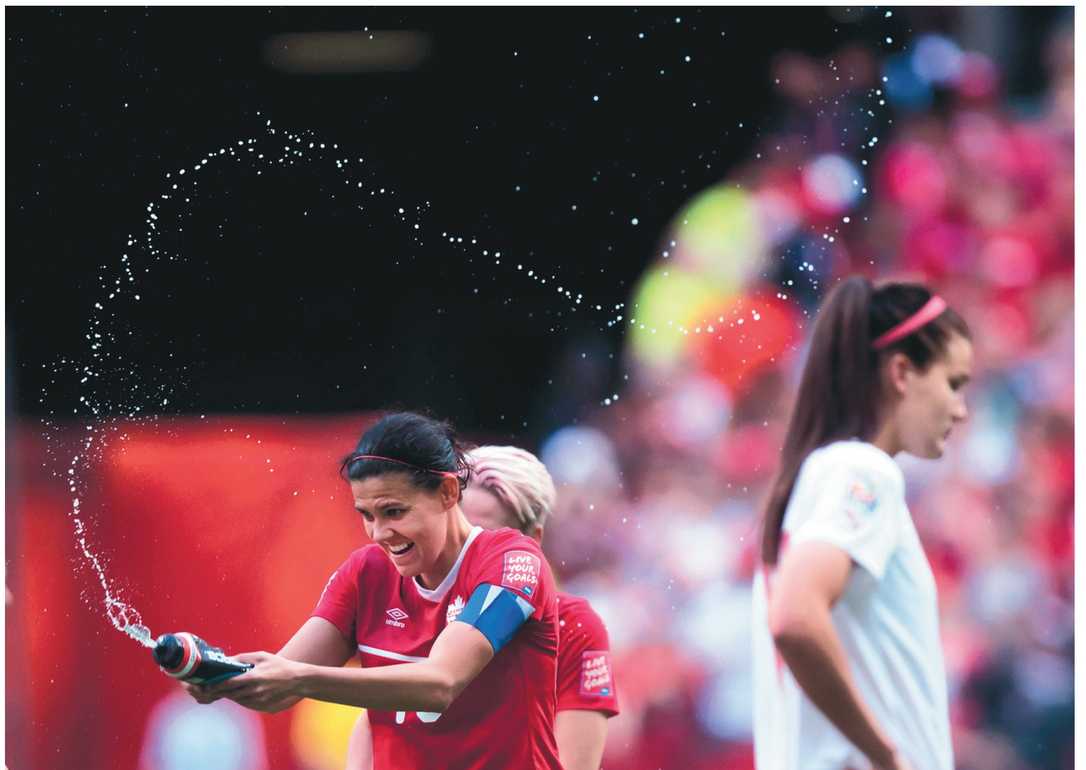
DARRYL DYCK LA PRESSE CANADIENNE

Des voix s'élèvent régulièrement pour réclamer qu'à l'instar du numéro 42 de Robinson, le 21 de Clemente soit retiré à travers le baseball majeur. Ce ne serait pas une mauvaise idée.