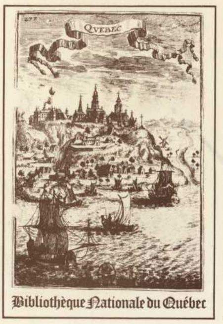
Bibliothèque Nationale du Québec