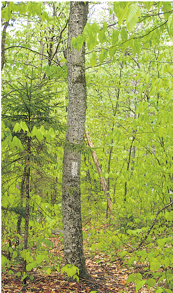
Les marques blanches sur les arbres permettent de se repérer sur le sentier. Les marques bleues indiquent les sentiers secondaires, vers un abri ou un point d'eau.