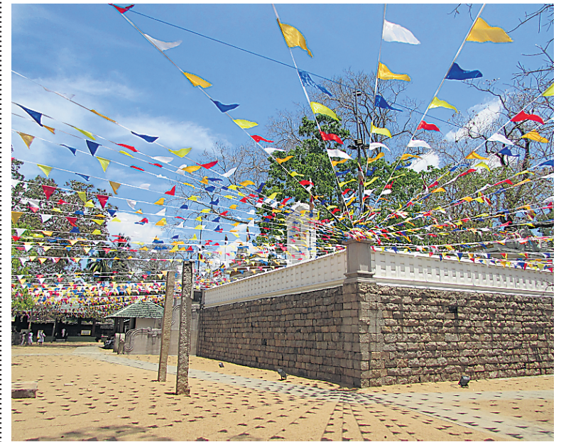
Difficile d'absorber le caractère du Sri Maha Bodhi, le plus vieil arbre authentifié dans le monde, quand nos pieds brûlants refusent de nous porter.

J'étais là, pieds nus sous le petit toit de l'entrée qui donnait accès