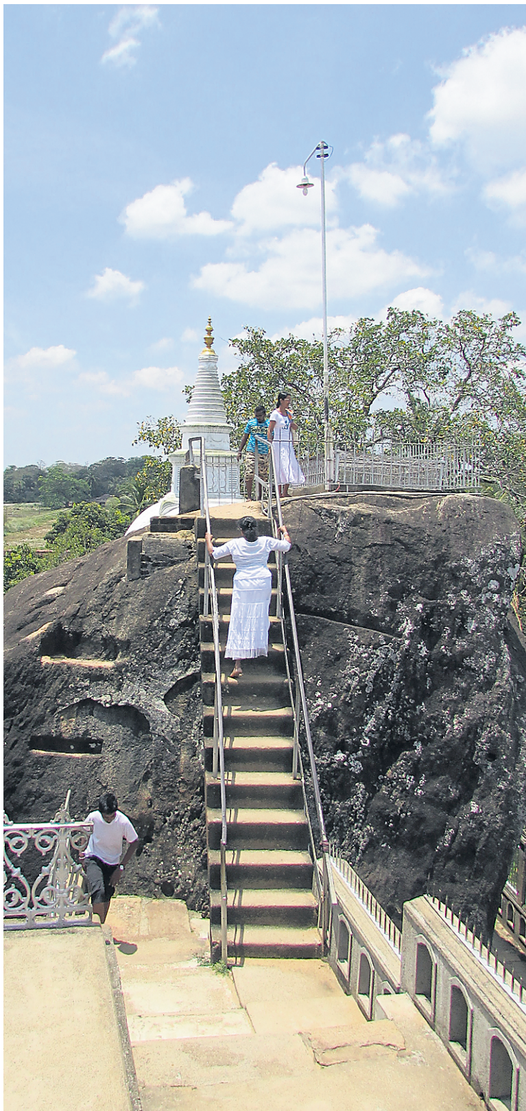
Il est impossible de grimper sur ce rocher sans grimacer devant la douleur que provoque la pierre chaude.

J'utilisais donc la stratégie du «Ouch! Ouch! Ouch! Assis!» pour progresser en supportant la douleur. Trois pas et un petit repos pour les pieds. Pendant que les Sri-lankais riaient de me voir claudiquer, comme les autres touristes, j'avais mis de côté toute mon admiration pour le vieil arbre en me demandant comment je regagnerais la sortie.