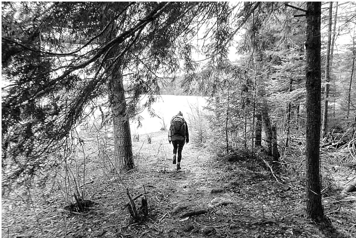
Une femme seule risque davantage. Ours et cougars menacent les randonneurs sur le sentier, mais, pour les femmes, l'homme peut aussi s'avérer être un dangereux prédateur.