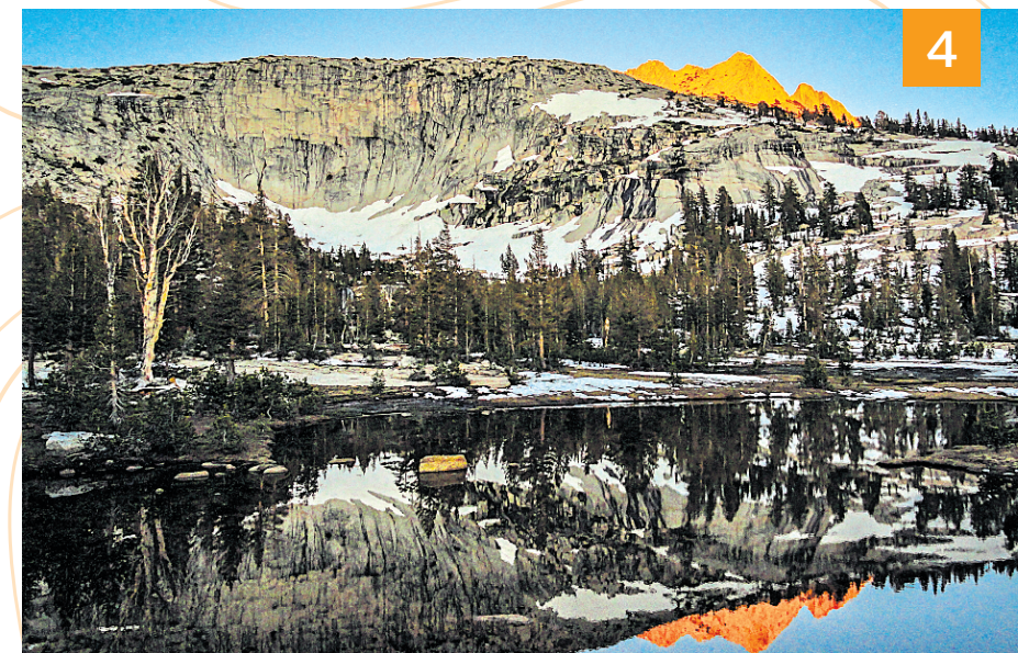
4. La Sierra