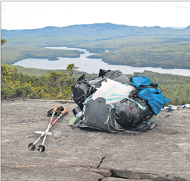
La règle de base : votre sac, une fois rempli, devrait peser moins que le quart de votre poids; le tiers pour une personne très active.

Les marcheurs se souviennent avec délice du moment où ils sont tombés sur une boîte magique. Ces boîtes ou glacières, disposées à quelques endroits sur le sentier des Appalaches, contiennent des boissons gazeuses, des bonbons et autres denrées alimentaires. Elles sont remplies régulièrement par des bénévoles. L'inscription «Trail Magic», apparente sur les boîtes, représente aussi tous les actes de générosité des non-randonneurs envers les randonneurs. GABRIELLE THIBAUT DELORME (COLLABORATION SPÉCIALE)